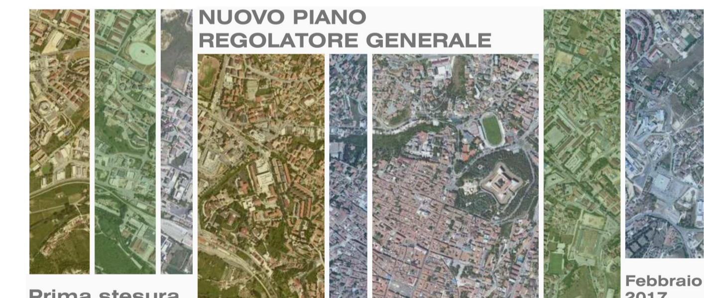
Prima stesura Febbraio 2017