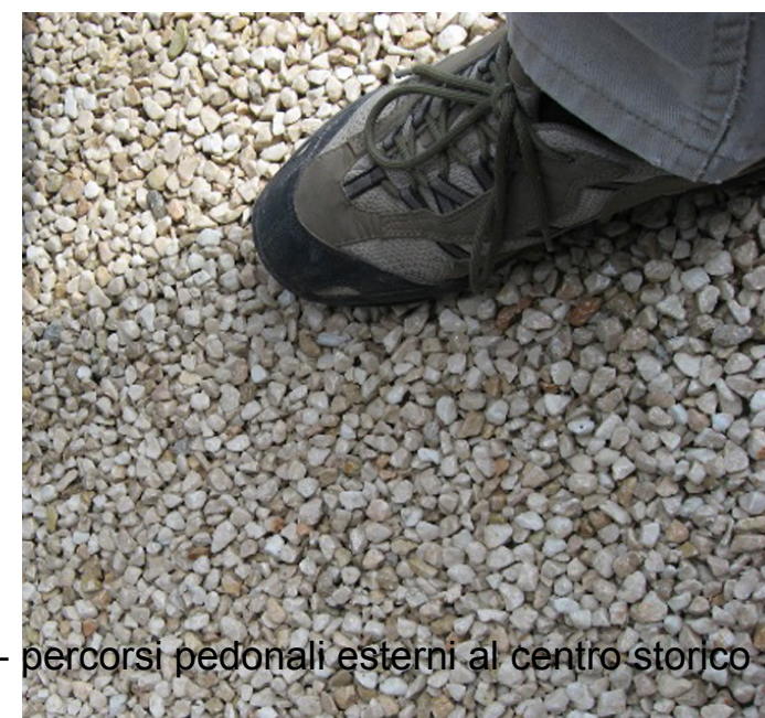
Pavimenti con resine e materiali lapidei locali - percorsi pedonali esterni al centro storico