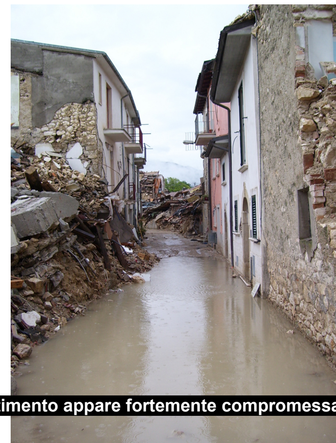
Nel centro storico in seguito al terremoto la rete di smaltimento appare fortemente compromessa

Per il centro storico si propone di riprendere le antiche pavimentazioni in pietra locale