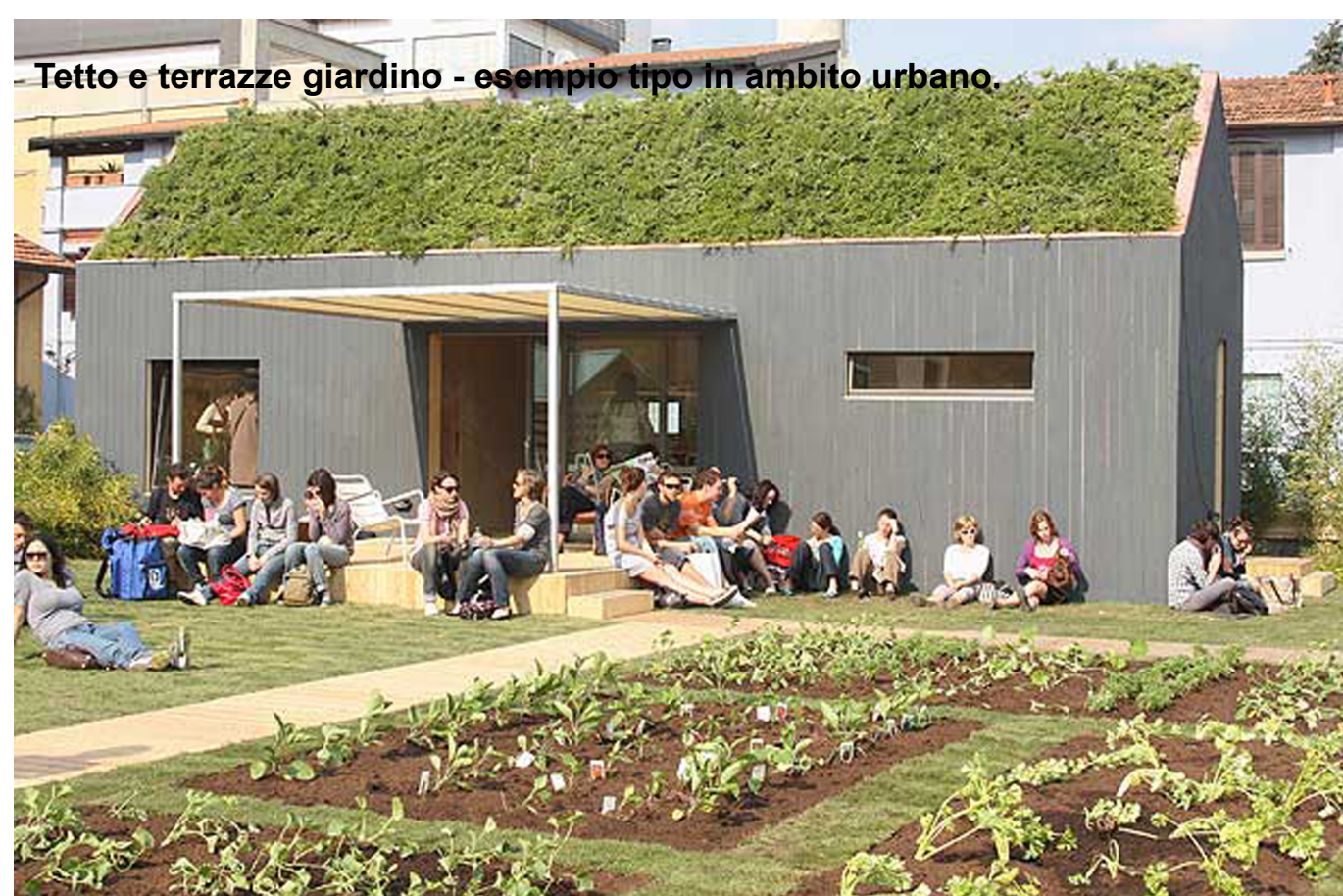
Tetto e terrazze giardino - esempio tipo in ambito urbano

Anche all'interno degli aggregati si dovrà considerare la percentuale di superficie drenante, favorendo l'utilizzo nelle corti interne di pavimentazioni che favoriscono l'assorbimento dell'acqua meteorica.