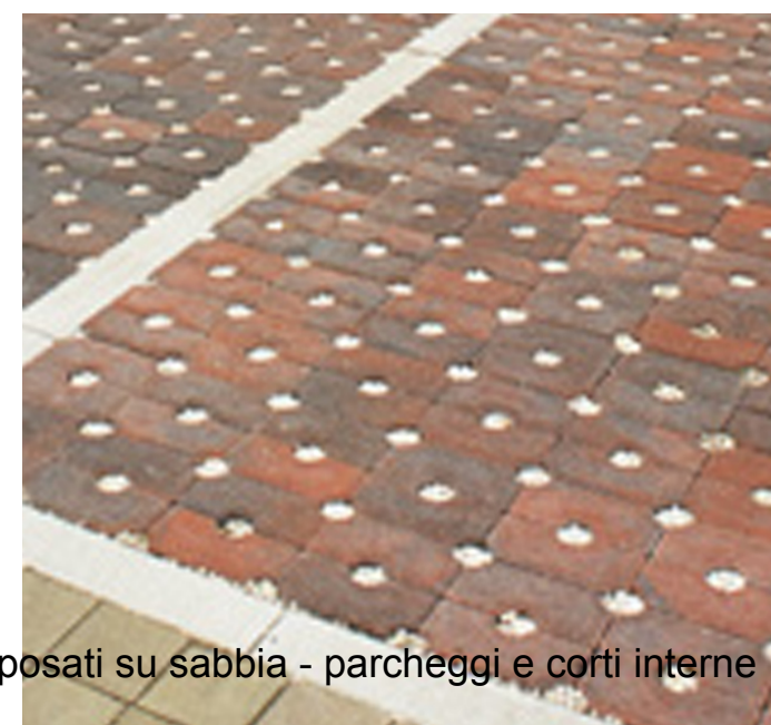
Blocchetti autobloccanti in calcestruzzo, posati su sabbia - parcheggi e corti interne

Esiste sul mercato una grande varietà di prodotti con caratteristiche idonee alle linee guida di progetto. Materiali con costi contenuti e soluzioni tecniche semplici.