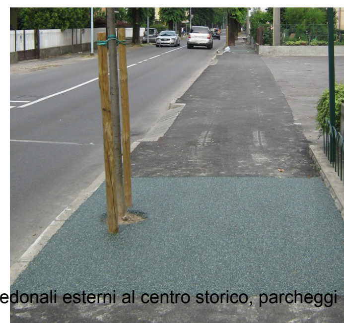
Asfalti fortemente drenanti - percorsi pedonali esterni al centro storico, parcheggi