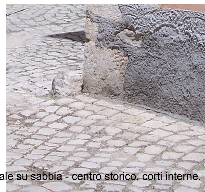
Blocchetti di pietra locale su sabbia - centro storico, corti interne