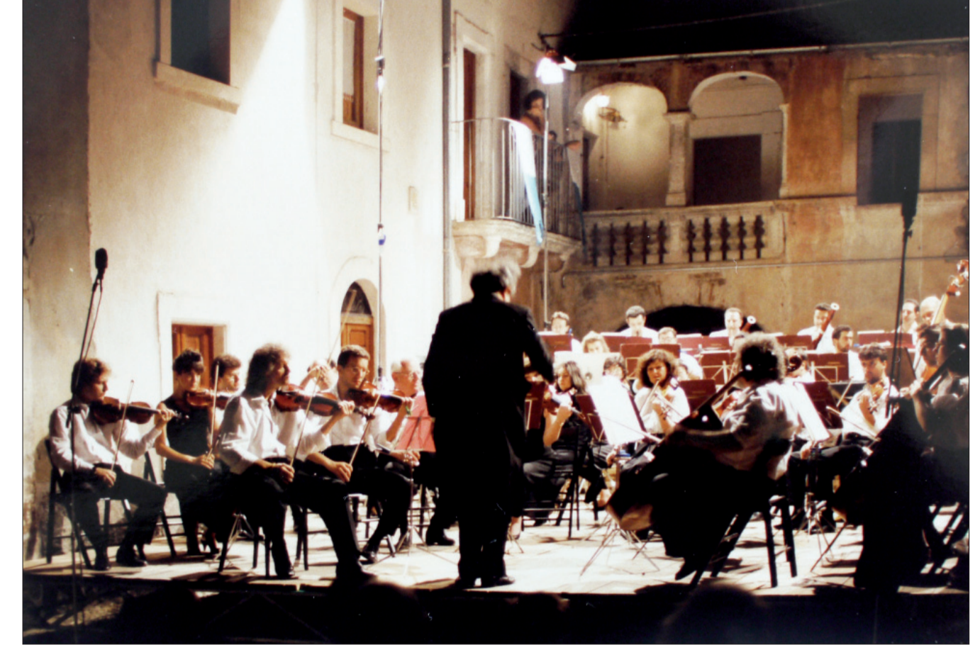
Concerto all'interno del cortile