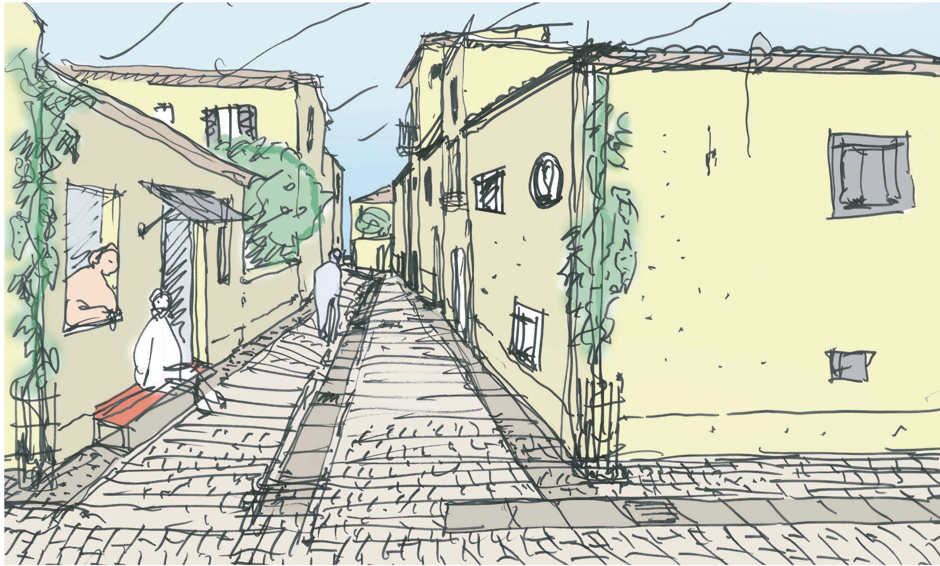
2 Veduta lungo via delle Siepi