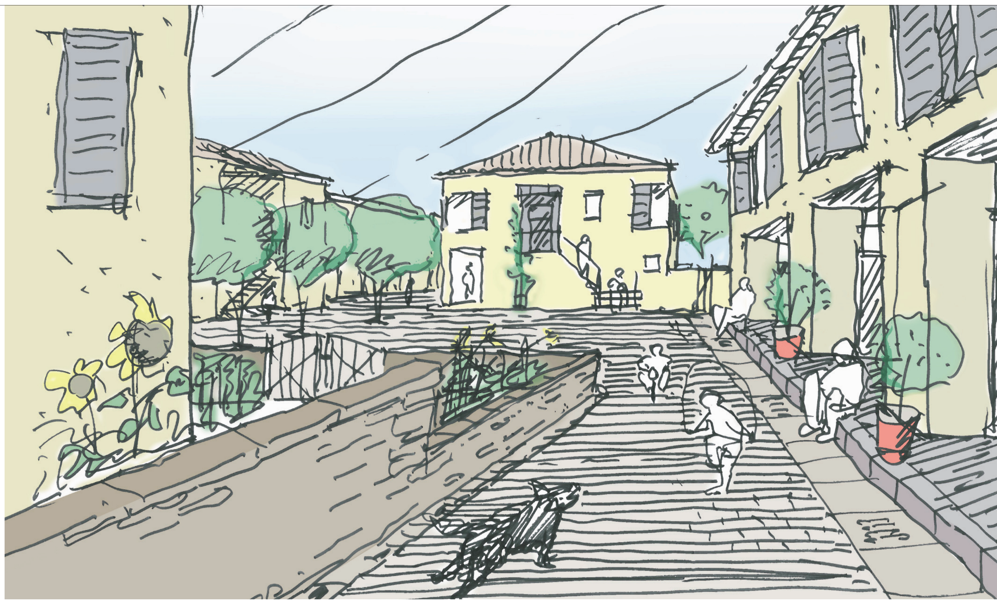
1 Veduta della piazzetta del nucleo residenziale in via delle Siepi