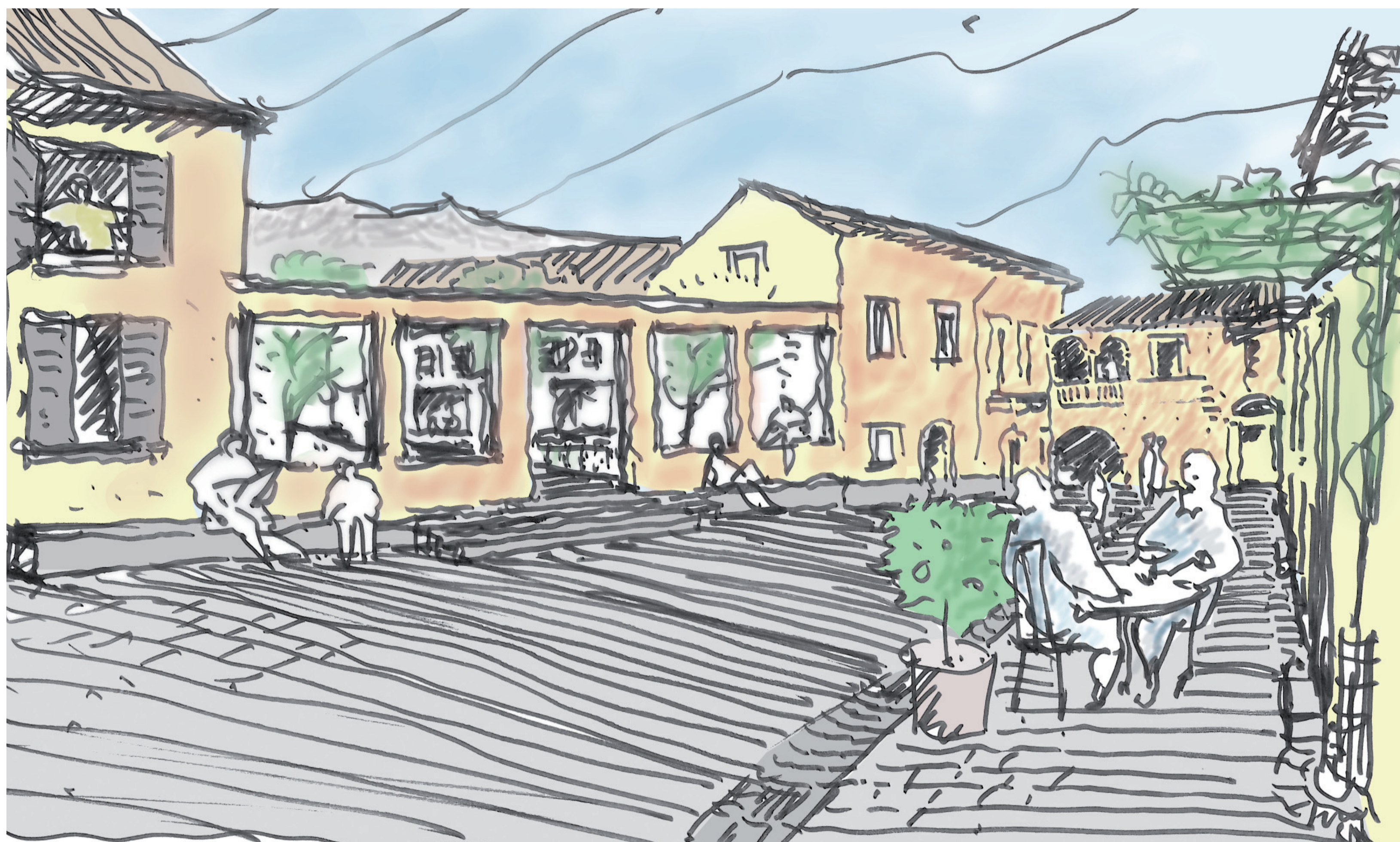
3 Proposta della ricostruzione del cortile vicino Piazza S. Pietro