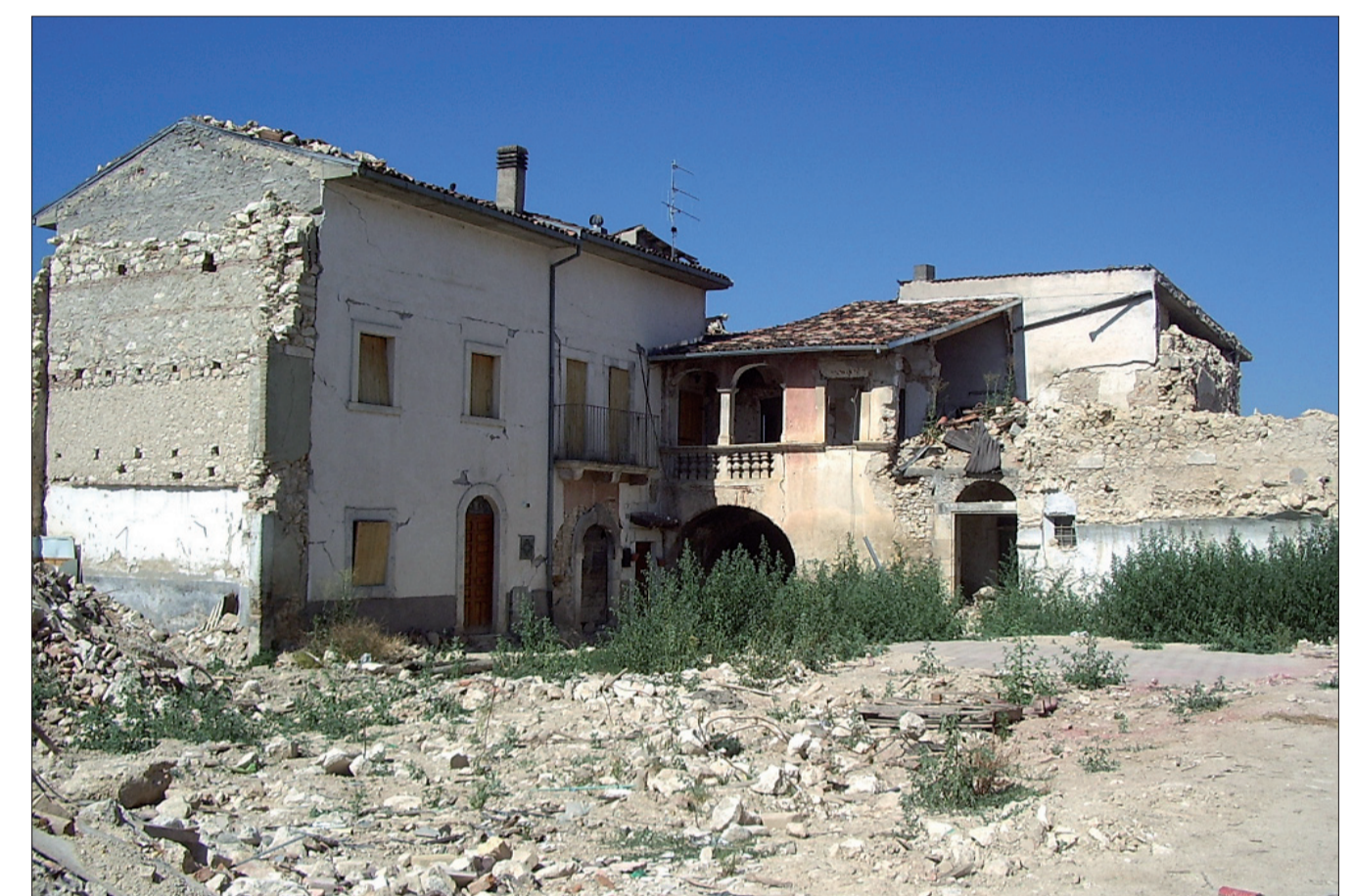
Il cortile dietro la via Prepositura – post-sisma

Allo stesso tempo la storica Onna si compone di due facce. Verso lo spazio pubblico case e palazzi volgono le facciate visibili a tutti e di cui la visione d'insieme individua l'immagine complessiva del paese. Ciò che si trova nel retro (l'altra faccia), è il più o meno privato mondo dei vicini che convivono assieme "muro a muro" e che per questo devono trovare un accordo reciproco. Ci sono cortili come quello al retro della via Prepositura dove nel passato hanno avuto luogo assemblee e concerti. L'immagine del luogo è dunque in un'area dall'area privata, solo là dove questa è prossima allo spazio pubblico, e dunque visibile, ma anche dove la sua organizzazione è in diretto rapporto con il paesaggio circostante. Ci sono inoltre spazi di vicinato con carattere semi-pubblico, a volte pubblicamente accessibili, che, come luoghi di vita, devono rispondere in primo piano alle esigenze private dell'aggregato dei corrispettivi proprietari, ma poiché l'immagine del paese è in un'area da questi, devono anche sottostare al controllo e alla partecipazione della comunità.