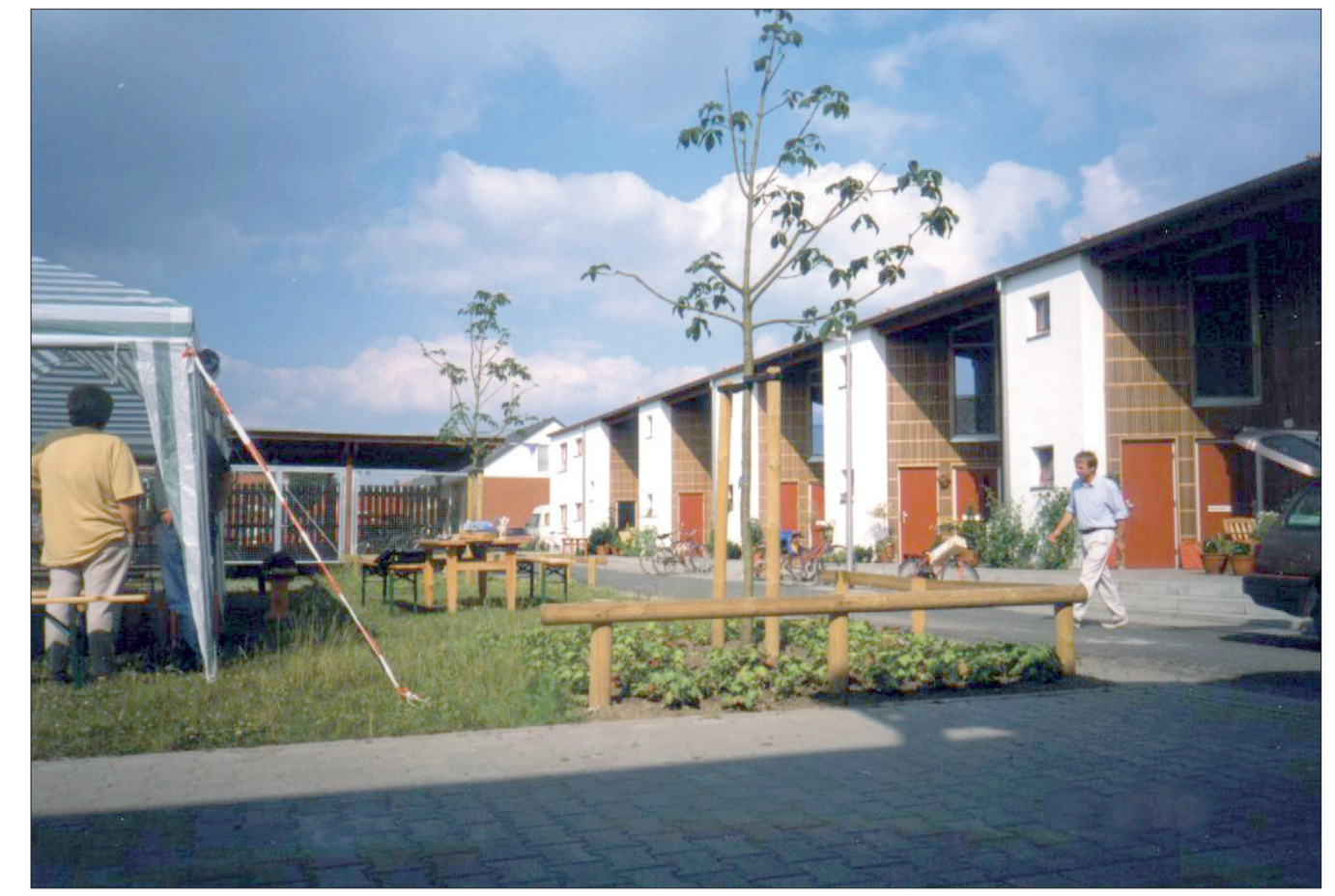
Casa a schiera in Münster-Mecklenblock, progetto Schaller/Theodor Architekten BDA