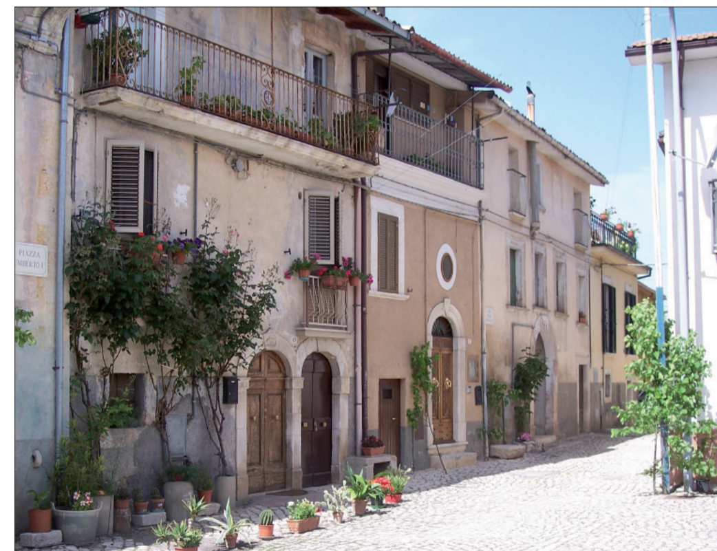
Scorcio via delle Massale prima del sisma