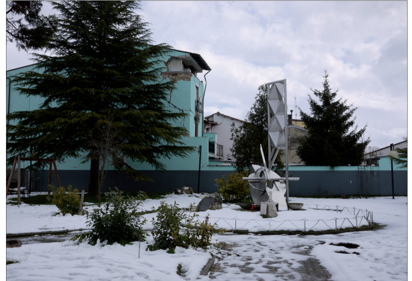
Giardino pubblico „della villa“ prima del sisma