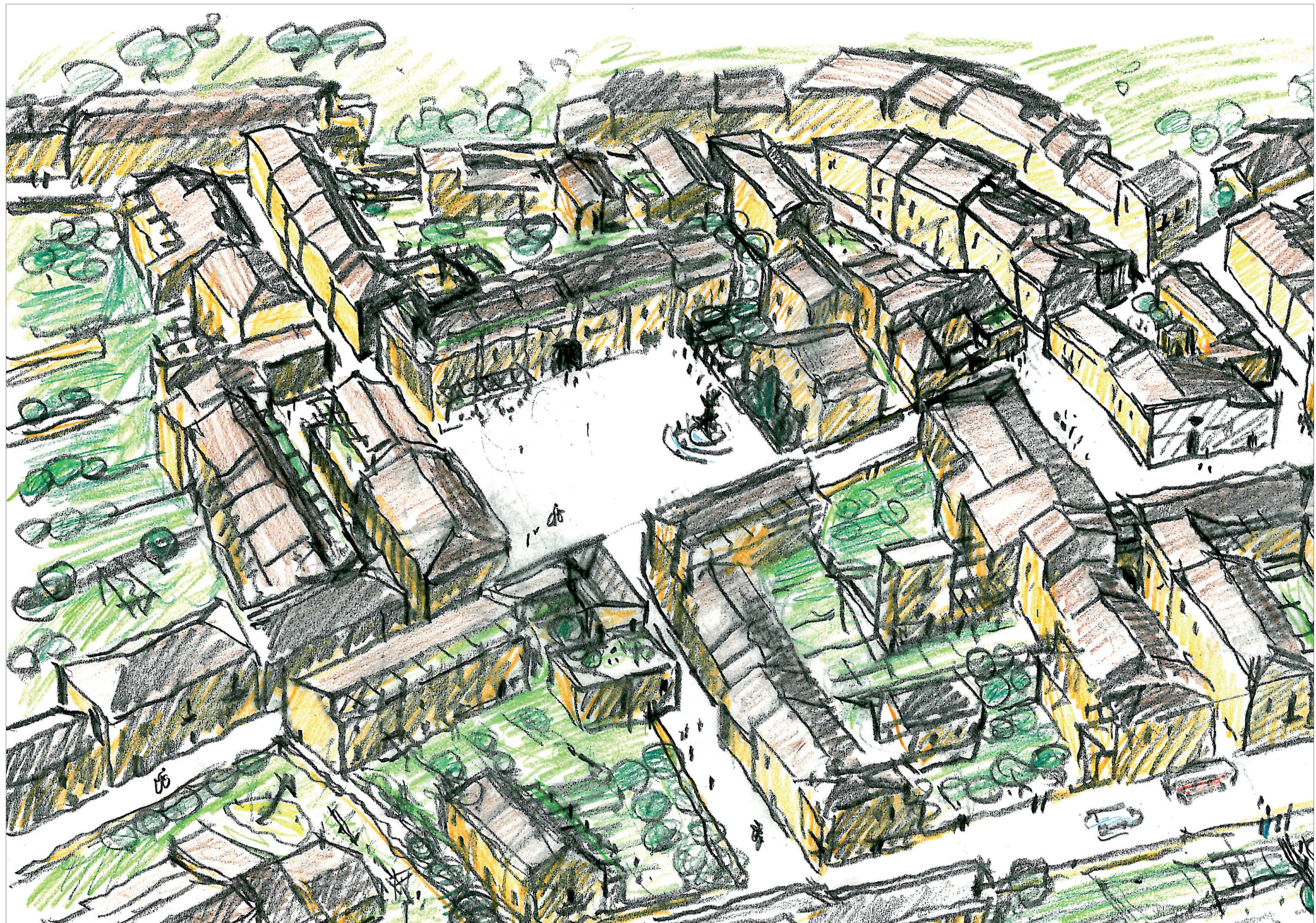
Piazza nuova – proposta masterplan