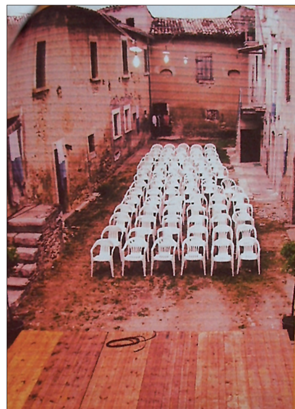
Aggregato 5 – concerto nella corte