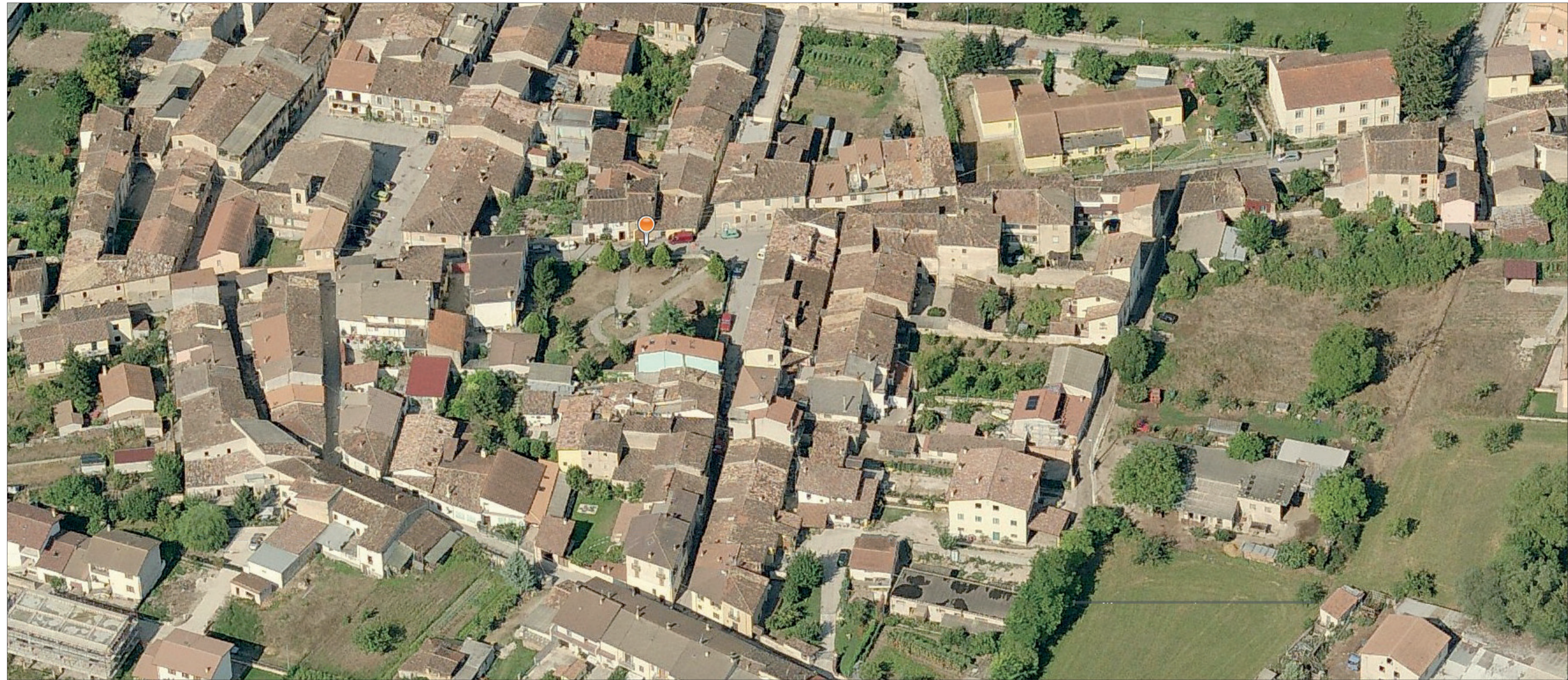
Veduta Onna pre-sisma