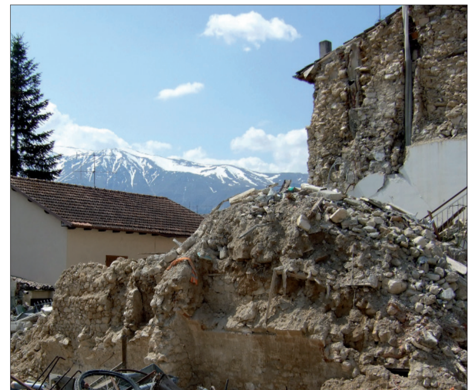
Aggregato 5 – immagine post-sisma