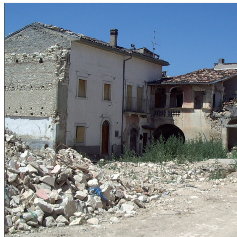
Aggregato 5 – corte, immagine post-sisma