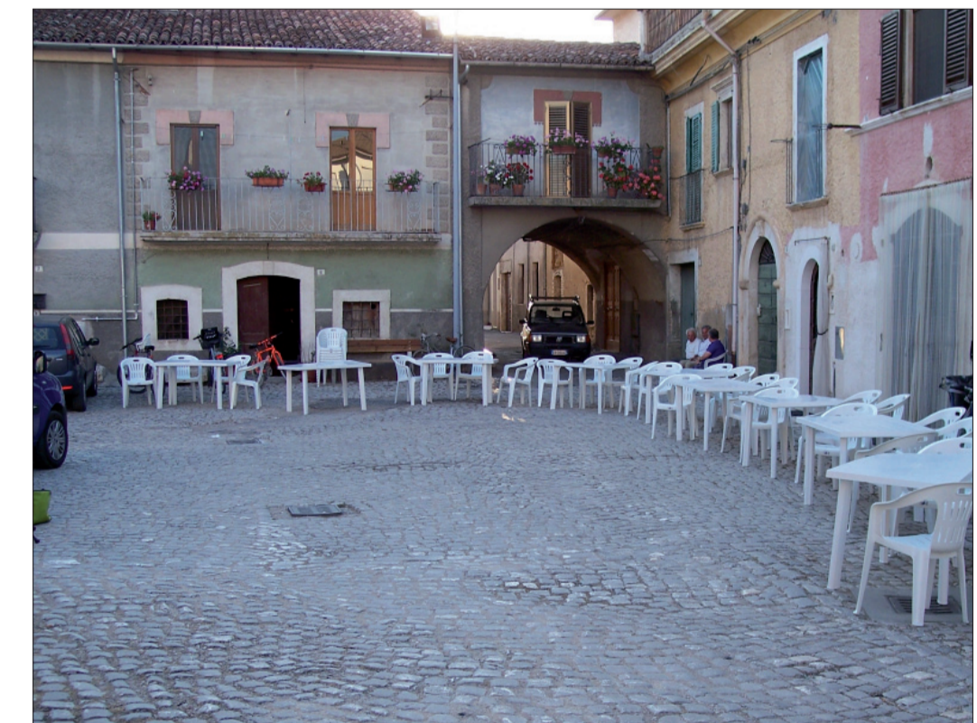
Piazza S. Pietro prima del sisma