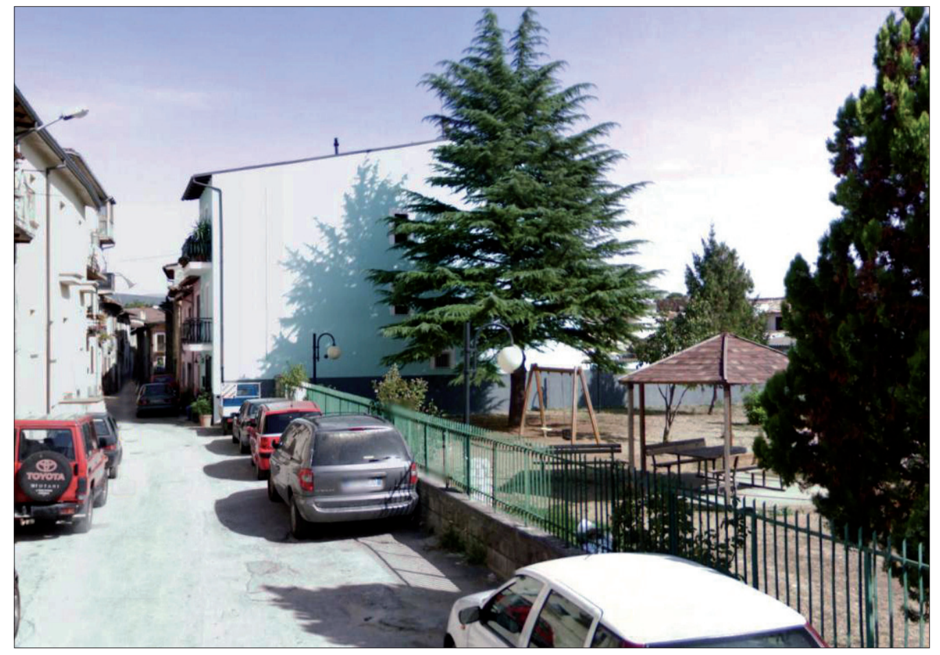
Giardino „della villa“ prima del sisma