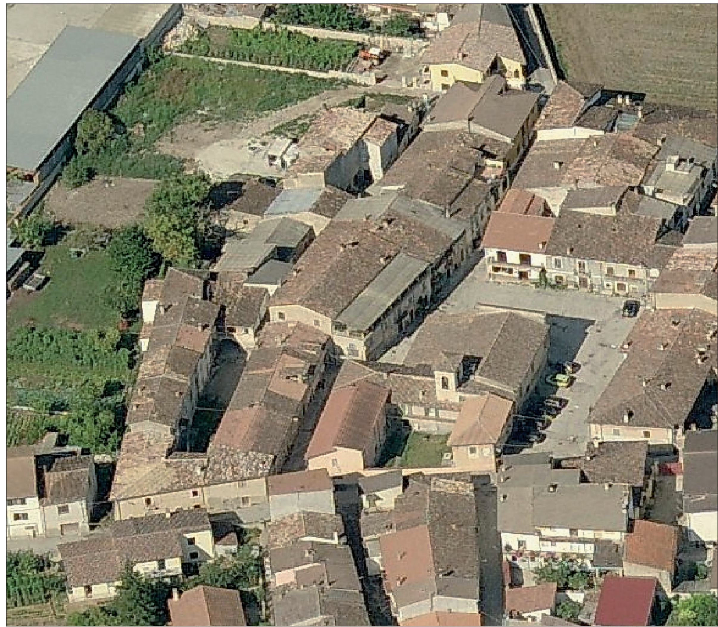
Veduta aggregato 5 e piazza S. Pietro