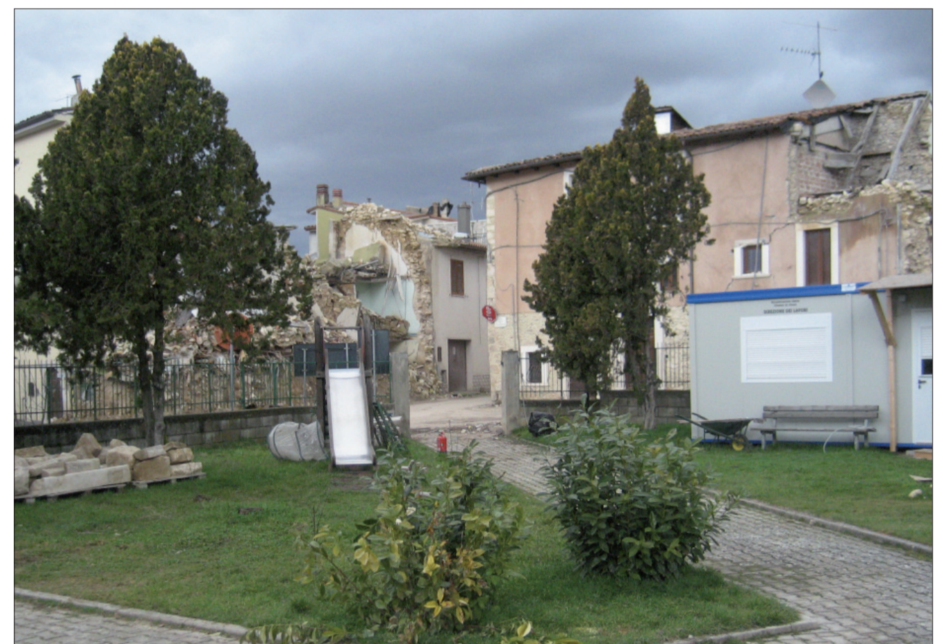
Giardino pubblico „della villa“