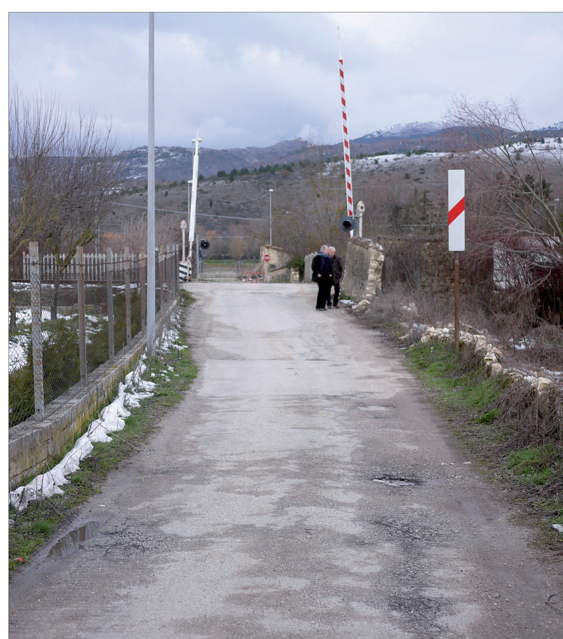
2 Passaggio a livello via degli Oppieti

Previsioni P.R.G. Tot. 52.000 mq Sic + P.E.E.P.