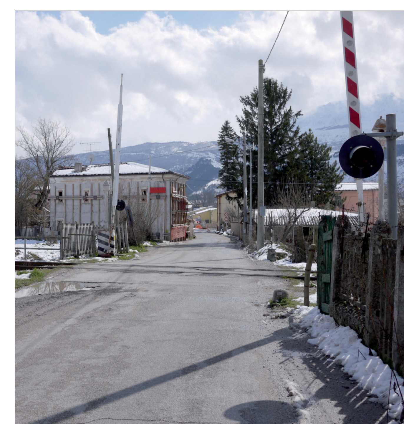
1 Passaggio a livello via dei Martiri