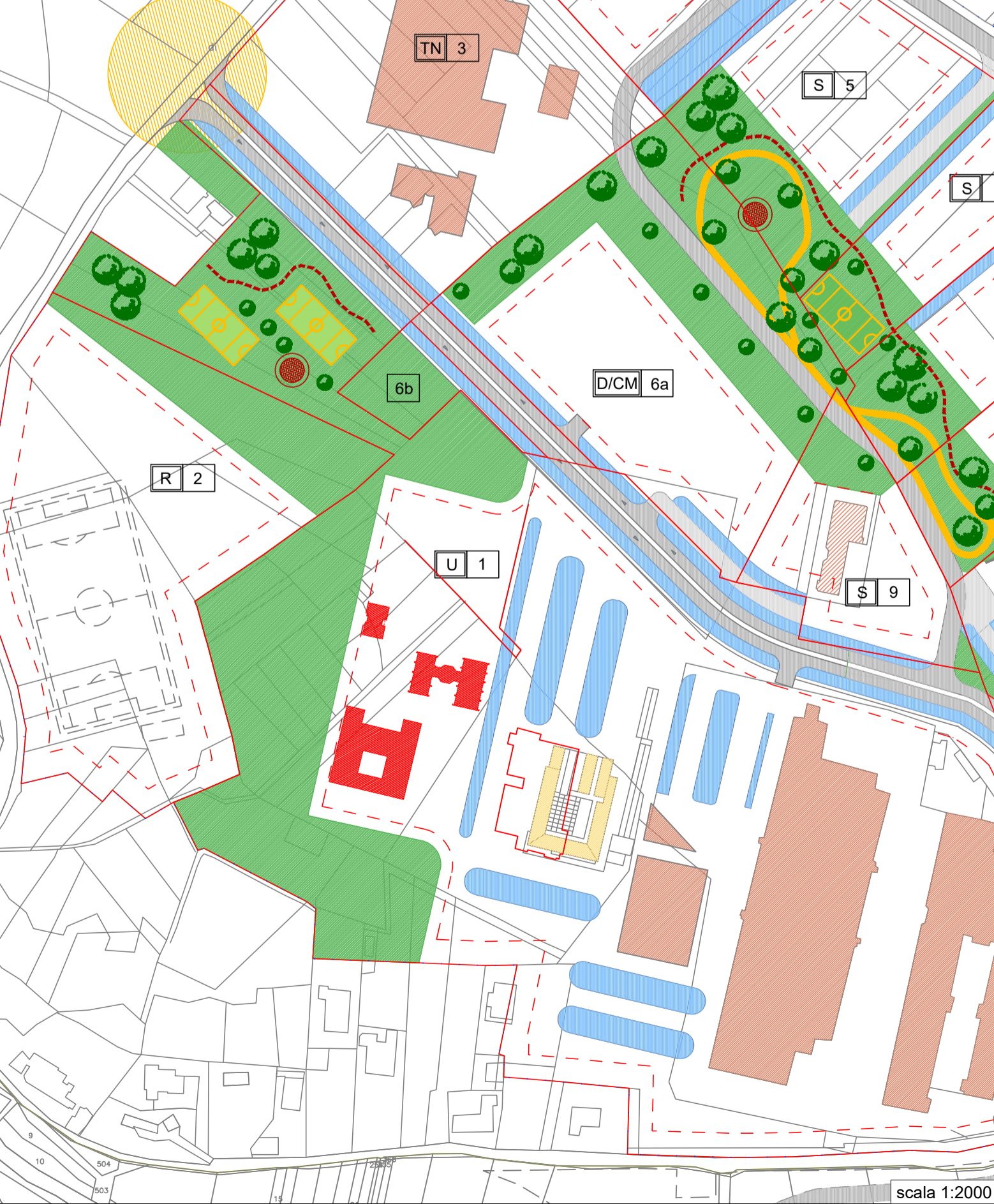
Planimetria Accordo di Programma PDC Lenze di Coppito