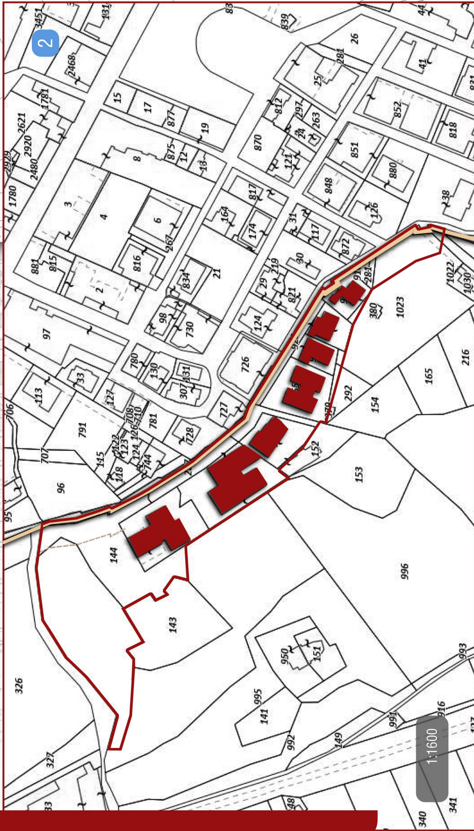
tav. 1_7 proprietà edifici, destinazioni d'uso, demolizioni