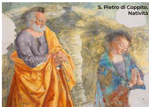
S. Pietro di Coppito, Natività

In paese di rilievo è la chiesa dei Santi Cosma e Damiano, con una facciata quadrangolare in pietra e un portale tardorinascimentale; nella frazione Termine si trova il Palazzo Ludovisi . A Barete (8 km ad est), in via Roma, si trova la chiesa di San Paolo (XIII sec.); sorge nel sito dell'antica Lavaretum. Di rilievo nella facciata il portale rinascimentale e il campanile a vela. A 2,5 km verso l'Aquila si trova il borgo di Pizzoli , con il Palazzo Dragonetti de Torres (1562) e l'adiacente chiesa di Santo Stefano al Monte ,