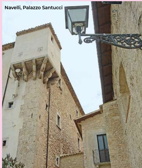
Navelli, Palazzo Santucci

From the square of Collemaggio moving south, in 200 meters we reach the Parco del Sole, with a great naturalistic value of almost 4 hectares with robinias, cypresses, domestic pines, Judas trees, cedars and horse chestnuts. It consists of a playground, a nature trail and a show area with the Amphisculpture designed by the artist Beverly Pepper, an out-