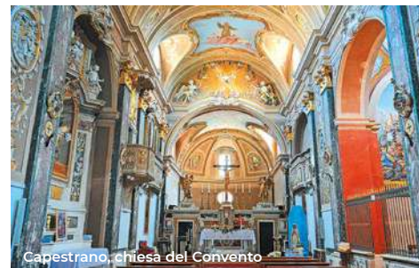
Capestrano, chiesa del Convento

Si prosegue verso il borgo medievale di Capestrano sulla vecchia SS153 (8 km). Il centro domina la Valle del Tirino (465 m s.l.m.), sovra-