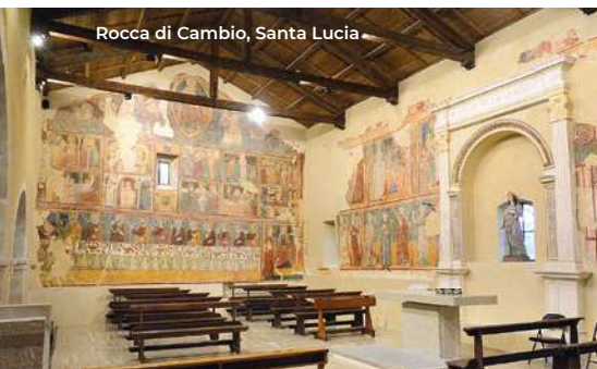
Rocca di Cambio, Santa Lucia

bella stagione a Campo Felice ci sono impianti che portano in quota ed è attivo un bikePark con percorsi differenziati per grado di difficoltà; vi è anche un'ampia scelta di passeggiate in tutto relax tra le faggete (per le visite Punto Informazione del Parco a Rocca di Mezzo tel. 0862 916125).