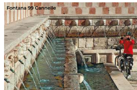
Fontana 99 Cannelle

nel XIII secolo, parteciparono alla fondazione dell'Aquila. Risalendo i gradoni della Fontana ci si trova di fronte la chiesa di San Vito alla Rivera . Coeva alle mura, ha una facciata continua rivestita in pietra bianca, inquadrata tra lesene. Ha un portale lunettato e un oculo con, ai lati, due meridiane (per la visita: tel. 0862 26059). Nei pressi si trova l'ingresso del Museo Nazionale d'Abruzzo (MuNDA). Istituito agli inizi degli anni '50 nella storica sede del forte spagnolo, oggi ospita in sette sale un corredo di opere altamente rappresentativo dell'arte abruzzese, dalle antiche civiltà degli Abruzzi fino al barocco, con reperti archeologici, sculture e pitture (orari di apertura su www.museonazionaleabruzzo.beniculturali.it ). Risalendo verso il centro si può attraversare il Borgo della Rivera, primo nucleo urbano (XIII sec.), fino alla sommità dove c'è il Convento dei Cappuccini di Santa Chiara , che sorgeva sopra una chiesetta dell'XI secolo.