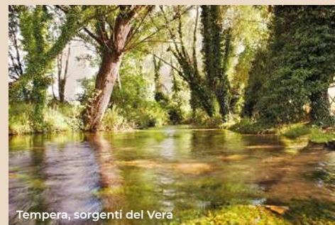
Tempera, sorgenti del Vera

houses (late 13th century). It is made of stone with a large double-arched arch, flanked by two pairs of simple pilasters. Above there is the coat of arms of the Bernardinian order. Go through the door and head left on via Costa Pienze along the city walls, then take via Sforza on the right. After two hundred meters we turn left onto via Jacobucci to land at the Palazzo dell'Emiciclo.