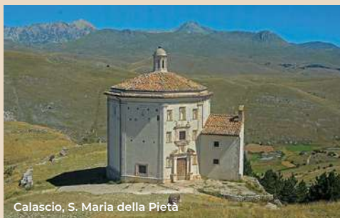
Calascio, S. Maria della Pietà

at the bottom of the right side nave where the chapel-sepulcher of Celestino V is located, containing its body (XVI century). It was built on a project by Girolamo da Vicenza in imitation of the San Bernardino mausoleum. The Basilica is open every day from 9.30 to 12.30 and from 15 to 18.