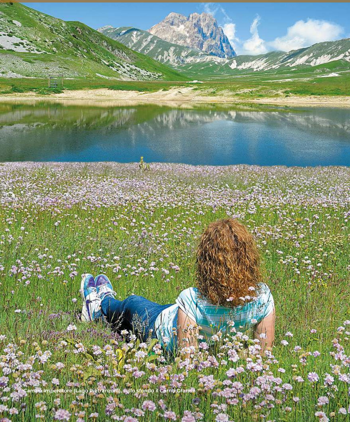
Campo Imperatore (Lago Pietranzoni), sullo sfondo il Corno Grande