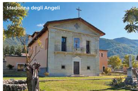
Madonna degli Angeli

per la presenza del celebre lago, caratterizzata da limpide acque e dalla flora variegata che circonda l'invaso, come orchidee selvatiche, primule, ginestre, oltre a cerri, abeti e faggi. Il lago, con 30 km di sponde, offre ai fruitori della vacanza attiva ottimi spunti per praticare il windsurf, il kitesurf e il kayak, oltre che il cicloturismo e l'equiturismo. Proseguendo la strada lungolago, si raggiunge Capitignano , dove si trova la chiesa di San Flaviano (XVI sec.), dall'impianto a croce latina, a tre navate, con grande cupola ottagonale. All'interno si trova un ciborio di legno intagliato del XVI secolo (attualmente in restauro).