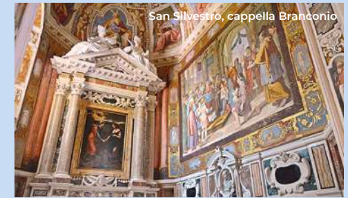
San Silvestro, cappella Branconio