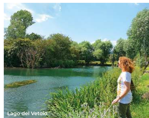
Lago del Vetoio

navata unica con soffitto cassettonato; pregevoli gli affreschi manieristi con le scene di vita di San Pietro e la Natività di Saturnino Gatti, recentemente restaurata (per le visite tel. 340 2656214). Da Coppito ci si sposta al Parco del Vetoio (4 km) per una passeggiata, passando per via del Duomo e Via Vetoio: si tratta di un parco urbano con un interessante laghetto, che offre rifugio a importanti specie di avifauna, come l'airone cinerino, la garzetta, l'airone rosso, il cormorano, la folaga, il germano reale e il martin pescatore. Proseguendo in direzione sud (9 km) si arriva a Poggio di Roio dove sorge il Santuario barocco della Madonna di Roio (XVI sec.), a navata unica, il cui interno è decorato da stucchi che circondano l'altare (per la visita la chiesa è aperta il sabato e la domenica dalle 10 alle 17). A circa 1 km si può raggiungere