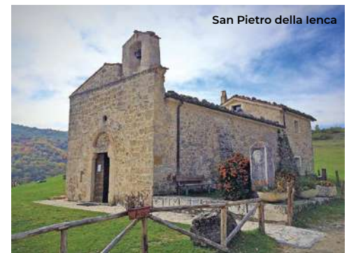
San Pietro della Jenca

Nella Valle del Vasto si trovano luoghi suggestivi, come il piccolo santuario di San Pietro della Jenca (7 km), spesso visitato da papa Giovanni Paolo II che qui si è raccolto in preghiera; è presente anche il centro di documentazione "Casa di Karol" (Per visite tel. 349 8113727).