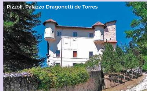
Pizzoli, Palazzo Dragonetti de Torres

From the square of Collemaggio moving south, in 200 meters we reach the Parco del Sole, with a great naturalistic value of almost 4 hectares with robinias, cypresses, domestic pines, Judas trees, cedars and horse chestnuts. It consists of a playground, a nature trail and a show area with the Amphisculpture designed by the artist Beverly Pepper, an outdoor limestone theater that incorporates the