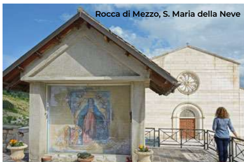
Rocca di Mezzo, S. Maria della Neve

Appena fuori il centro abitato (2 km direzione nord) è possibile visitare l' abbazia di Santa Lucia . È in stile romanico-gotico (XIII sec), con facciata tripartita e campaniletto a vela, e conserva un pregevole ciclo di affreschi trecenteschi, che raffigurano Santa Lucia ed altre