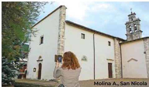
Molina A., San Nicola

mulino con frantoio e segheria (X sec.), adiacente i ruderi della chiesa di S. Antonio. (per visite guidate ai monumenti tel. 347 9048731, per l'apertura delle chiese tel. Comune 0864 799132). Procedendo ancora a sud si raggiunge il centro di Molina Aterno (5 km), dove conviene fermarsi alla chiesa di San Nicola di Bari (XIII sec.), con la facciata in tardo stile rinascimentale e la lunetta del portale in stile romanico (per la visita chiedere al tabaccaio di fronte). In piazza si trova anche il Palazzo Piccolomini (XV sec.), con cortile porticato, ballatoio rinascimentale e portale a bugne.