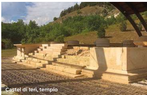
Castel di Ieri, tempio

Seguendo ulteriormente verso sud (3 km), si raggiunge il borgo fortificato di Castel di Ieri , in cui spicca l'imponente torre quadrata di origine normanna. Notevole è anche la chiesa di Santa Maria Assunta (XVI sec.), con portali rinascimentali in pietra (per le visite tel. 331