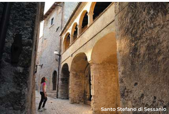
Santo Stefano di Sessanio

Salendo da Castel del Monte verso la montagna, rientrando in territorio aquilano, si scoprono gli immensi spazi di Campo Imperatore. È uno straordinario ambiente montano appenninico fatto di boschi, piani carsici, pascoli di quota, rupi, ghiaioni, cime innevate, che si spinge per oltre 30 km. È base ideale, come anche le località di Aragno e Collebrincioni, per passeggiate a cavallo e in mtb, per lo sci di fon-