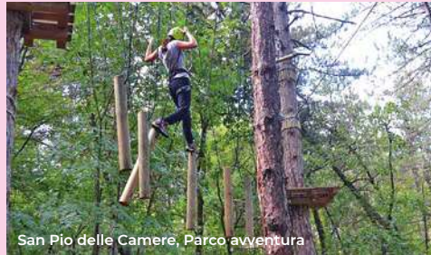
San Pio delle Camere, Parco avventura

Internally, guided by the geometric games of the pavement, between some frescoes of the fourteenth and fifteenth centuries, we arrive