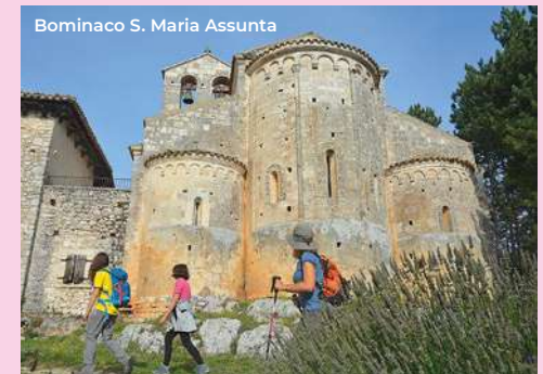
Bominaco S. Maria Assunta

Going further 300 meters south we arrive at Porta Napoli. Always part of the urban wall system of the city, the gate was built in 1820 following the urban expansion process. It consists of a pointed arch channeled between two pilasters. This second itinerary starts from the church of S. Maria del Soccorso, located to the north-east, outside the city walls. Built in the late fifteenth century. it is striking for the original synthesis between medieval and renaissance elements, always with .