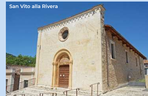
San Vito alla Rivera

The square-plan building houses an internal courtyard surrounded by four large corner bastions. The perimeter is surrounded by a huge moat from which stands.