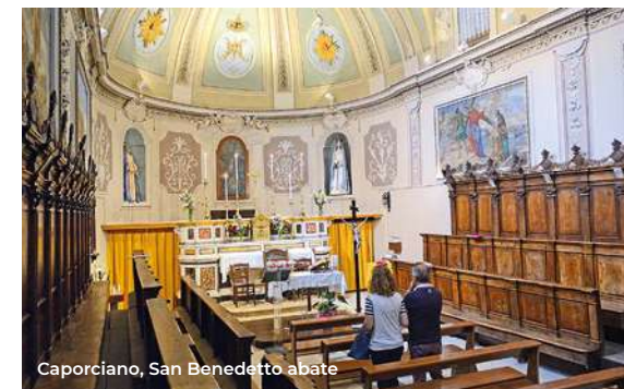
Caporciano, San Benedetto abate

Da Tussio si raggiunge Caporciano (5 km),