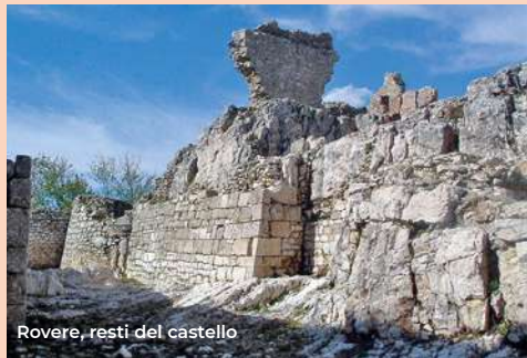
Rovere, resti del castello

Internally, guided by the geometric games of the pavement, between some frescoes of the fourteenth and fifteenth centuries, we arrive at the bottom of the right side nave where the chapel-sepulcher of Celestino V is located, containing its body (XVI century). It was built on a project by Girolamo da Vicenza in imitation of the San Bernardino mausoleum. The Basilica is open every day from 9.30 to 12.30 and from 15 to 18.