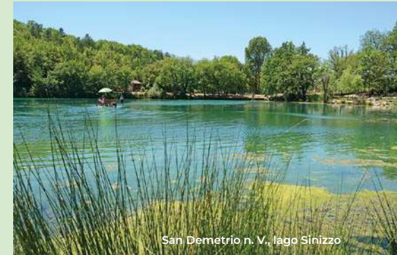
San Demetrio n. V., lago Sinizzo

Outside we are in the Villa Comunale, whose gardens were built from the second half of the nineteenth century; here there is the monument to Nicola D'Antino (1926), placed in line with the Hemiciclo, according to the "the