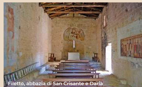
Filetto, abbazia di San Crisante e Daria