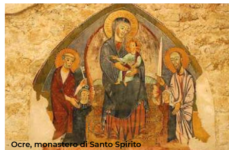
Ocre, monastero di Santo Spirito

Ci si muove verso il centro del paese ( San Panfilo d'Ocre ), da cui si può ammirare il profilo