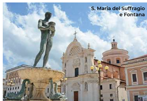
S. Maria del Suffragio e Fontana

lica di San Giuseppe Artigiano , già San Biagio (XIII sec.), nella cui facciata tripartita scandita da lesene si aprono tre portali in pietra a timpani aggettanti. L'interno ha un impianto basilicale a tre navate con pilastri corinzi. Di rilievo il monumento funebre Camponeschi, mausoleo equestre realizzato da Gualtiero d'Alemagna nel 1432. Adiacente la chiesa si trova l' Oratorio di San Giuseppe de' Minimi , che fa parte dello stesso complesso; la facciata, su via Roio, è di origine trecentesca ma rimaneggiata nel 1930, con due monofore gotiche e il portale lunetta-