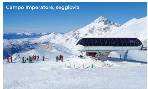
Campo Imperatore, seggiovia

Si prosegue scendendo verso Santo Stefano di Sessanio (18 km), tra i più suggestivi del Parco del Gran Sasso. Il borgo fortificato ha le abitazioni e i percorsi viari stretti e angusti, con case-mura col profilo scarpato e quelle su più piani. Da vedere la chiesa di Santo Stefano Protomartire (XIV sec.), ad aula unica con un'originale area presbiterale e la Torre medicea (XIV sec.) a pianta cilindrica, in fase di restauro. Il paese è un vero e proprio albergo diffuso con 300 posti letto, con strutture ricettive e servizi che mirano al recupero delle tradizioni locali; vi si trovano anche maneggi per passeggiate a cavallo e con l'asino. Da vedere il Museo delle