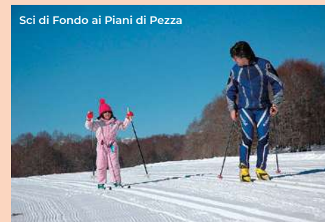
Sci di Fondo ai Piani di Pezza

Outside we are in the Villa Comunale, whose gardens were built from the second half of the nineteenth century; here there is the mo-