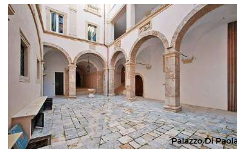
Palazzo Di Paola

come Palazzo del Capitano, fu restaurato nel XVI per diventare residenza di Margherita d'Austria. A lato del Palazzo, su via Cavour c'è la Torre civica , elemento superstite del Palazzo del Capitano, uno dei più antichi della città (XIII sec.). Proseguendo verso ovest su Via Bafile e poi su via Roma si arriva alla chiesa di San Pietro a Coppito , una delle chiese Capo-quarto dell'Aquila. La facciata a coronamento orizzontale è nel tipico stile medievale aquilano. Il portale, ricco di notevoli motivi ornamentali, è affiancato da due leoni in pietra di epoca romana (da Amiternum) e sovrastato da un rosone senza raggiera. Sul prospetto di sinistra si apre un portale laterale in stile borgognone (XIII sec.), mentre su quello di destra si erge una possente torre campanaria a pianta ottagonale (XIII sec.). L'interno è ad aula unica con copertura lignea. Di rilievo sono la presenza di una navatella a destra con arcate a tutto sesto e alcuni affreschi che vanno dal XIII al XVI secolo. Nella piazza antistante c'è la fontana a pianta dodecagonale con fregio di un'aquila, simbolo della città, e fontanile sovrastante.