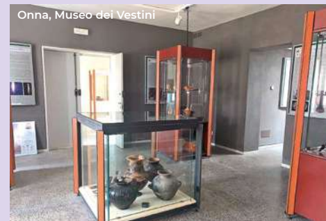
Onna, Museo dei Vestini

Outside we are in the Villa Comunale, whose gardens were built from the second half of the nineteenth century; here there is the monument to Nicola D'Antino (1926), placed in line with the Hemicycle, according to the "the great Eagle" project, with liberty villas and fascist-style buildings. From this period are: the Palazzo Ex Gil, born as Casa Balilla, located next to the Hemicycle on the south side; the church of Cristo Re, further south on Viale Crispi, in axis with the Basilica of Collemaggio. The rationalist-style church borrows the San