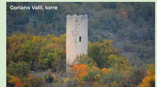
Goriano Valli, torre

Going further 300 meters south we arrive at Porta Napoli. Always part of the urban wall system of the city, the gate was built in 1820 following the urban expansion process. It consists of a pointed arch channeled between two pilasters. This second itinerary starts from the church of S. Maria del Soccorso, located to the north-east, outside the city walls. Built in the late fifteenth century. it is striking for the original synthesis between medieval and renaissance elements, always with the duotone white / red; the plan is a Greek cross