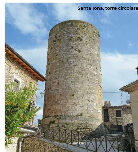
Santa Jona, torre circolare

località turistica sia invernale e sia estiva, nota per l'accoglienza turistica e per gli impianti sciistici. Questi ultimi sono presenti sul Monte Magnola (5 km a sud) all'inizio dell'altopiano delle Rocche con 30 km di piste per lo sci alpino. In estate alcuni impianti sono aperti e offrono la possibilità di bellissime escursioni in quota (info sugli Impianti tel. 0863 705058). Dal piazzale della Magnola si scende in paese (3 km). Il borgo medievale conserva una porta di accesso ad arco, Porta Mutiati , mentre nella frazione di Santa Jona (10 km verso Celano) rimane la Torre circolare (XIII sec.) facente parte dell'antica rete difensiva della Marsica. Qui in alcuni periodi si organizzano serate per l'osservazione delle stelle (Per info tel. 349 1242276). Interessante è anche la chiesa parrocchiale , che conserva una bella edicola rinascimentale.