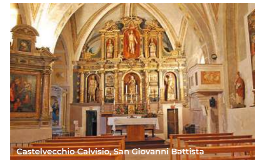
Castelvechio Calvisio, San Giovanni Battista

Da segnalare nel borgo Porta e chiesa di San Rocco , quest'ultima con una facciata "a vela"