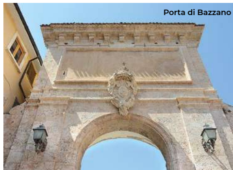
Porta di Bazzano

Tornando indietro e percorrendo via Belisari e poi Viale Caldora si arriva alla Porta di Bazzano (fine XIII sec.), forse la più imponente delle mura urbane della città, che appare in tutta la sua monumentalità tagliandosi tra le abitazioni. È realizzata in pietra con grande arco a doppio fornice. In alto, c'è il cristogramma di san Bernardino. Da qui, percorrendo la suggestiva scalinata di Costa Masciarelli, si può raggiungere piazza Duomo. L'itinerario, invece, continua tornando indietro