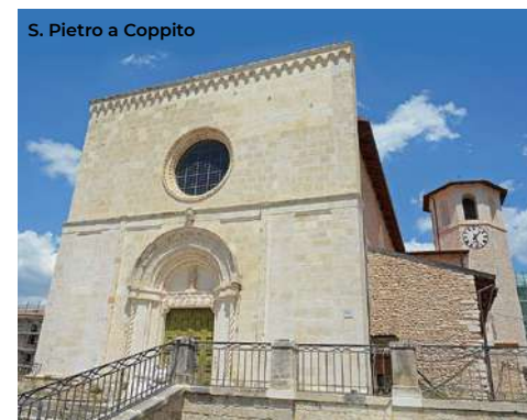
S. Pietro a Coppito

come Palazzo del Capitano, fu restaurato nel XVI per diventare residenza di Margherita d'Austria. A lato del Palazzo, su via Cavour c'è la Torre civica , elemento superstite del Palazzo del Capitano, uno dei più antichi della città (XIII sec.). Proseguendo verso ovest su Via Bafile e poi su via Roma si arriva alla chiesa di San Pietro a Coppito , una delle chiese Capo-quarto dell'Aquila. La facciata a coronamento orizzontale è nel tipico stile medievale aquilano. Il portale, ricco di notevoli motivi ornamentali, è affiancato da due leoni in pietra di epoca romana (da Amiternum) e sovrastato da un rosone senza raggiera. Sul prospetto di sinistra si apre un portale laterale in stile borgognone (XIII sec.), mentre su quello di destra si erge una possente torre campanaria a pianta ottagonale (XIII sec.). L'interno è ad aula unica con copertura lignea. Di rilievo sono la presenza di una navatella a destra con arcate a tutto sesto e alcuni affreschi che vanno dal XIII al XVI secolo. Nella piazza antistante c'è la fontana a pianta dodecagonale con fregio di un'aquila, simbolo della città, e fontanile sovrastante.