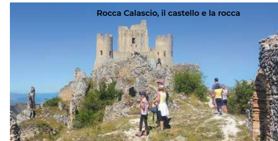
Rocca Calascio, il castello e la rocca

Proseguendo alla volta di Calascio è possibile salire fino alla celebre rocca (XIII-XV sec., 6 km