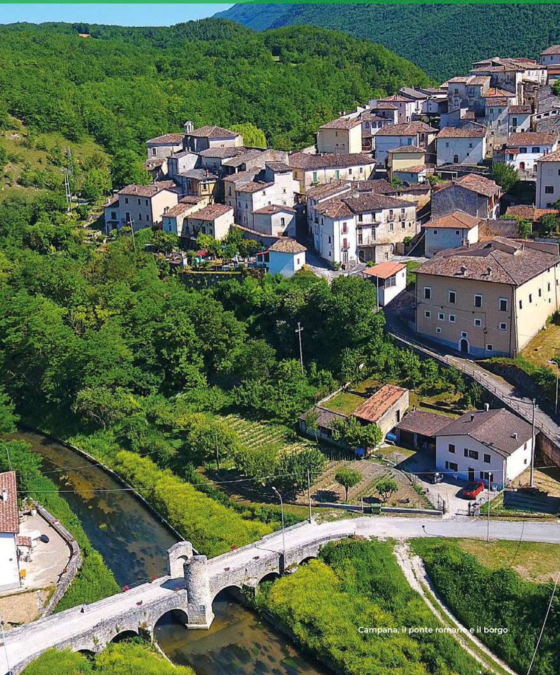
Campana, il ponte romano e il borgo