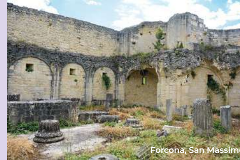
Forcona, San Massimo

comes the visitor by inviting him to enter is particularly important. In the colonnade we find some valuable sculptures, while under it in small newsstands there are 16 busts of illustrious Abruzzesi.