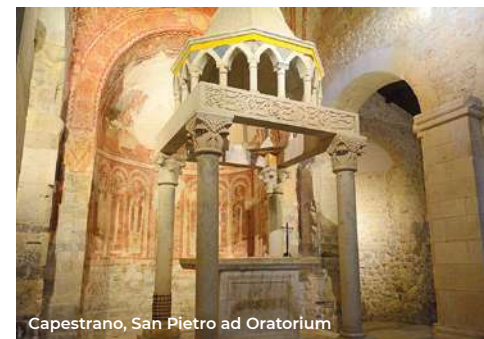
Capestrano, San Pietro ad Oratorium

Nei pressi si può usufruire dei numerosi servizi di turismo esperienziale: percorsi in canoa lungo il Tirino, trekking guidato con degustazioni tipiche, pedalate naturalistiche (per prenotazioni: tel. 085 9808009), passeggiate a cavallo e in carrozza (gps 42.2905, 13.7668, tel. 331 5669201). A 8 km verso sud si svolta a destra per San Pietro ad Oratorium (XII sec.), splendido edificio romanico. Sulla facciata è murato il misterioso quadrato magico del Sator, le cui 5 righe SATOR AREPO TENET OPERA ROTAS si leggono in tutte le direzioni. L'interno è scandito in tre navate con altrettante absidi; conserva un prezioso ciborio duecentesco e un bel ciclo di affreschi (aperto su prenotazione: www.musei.abruzzo.beniculturali.it ).