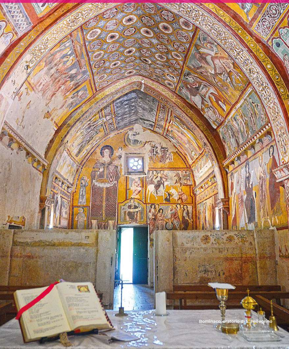
Bomnaco, oratorio di S. Pellegrino