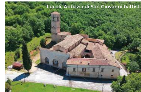
Lucoli, Abbazia di San Giovanni battista

Il viaggio prosegue verso Lucoli (25 km a valle) e in particolare la frazione di Collimento, dove si trova l' abbazia benedettina di San Giovanni Battista . La costruzione fu voluta dal Conte Odorisio e risale al 1077; sulla facciata a corona-