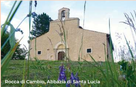
Rocca di Cambio, Abbazia di Santa Lucia

Il testo a seguire rappresenta la versione in inglese. Il testo è provvisorio. The first city itinerary begins with the religious and civil symbol of the city of L'Aquila, the Basilica of Santa Maria di Collemaggio, already declared a national monument in 1902.