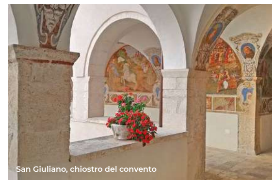
San Giuliano, chiostro del convento

Ci si sposta infine a Civita di Bagno (11 km in direzione sud), nell'antica Forcona, per visitare l' area archeologica (II sec. a.C.) e i resti imponenti della vecchia cattedrale (San Massimo, X sec.). Di questa chiesa oggi restano l'abside del Duecento, le mura perimetrali e le colonne delle tre navate; inoltre i resti della torre campanaria e le rovine del portico gotico e della cripta, posta sotto il piano del presbiterio (Per le visite SABAP, tel. 0862 21701 - 21730 - 21732). L'itinerario si conclude a Onna , dove si trova la chiesa di San Pietro Apostolo (XII sec.). È a navata unica con una facciata massiccia, un portale duecentesco e un piccolo rosone. Dopo il sisma 2009 è stata restaurata a spese del governo tedesco. Nei pressi merita una visita la Casa della Cultura che ospita il Museo dei Vestini e quello della Tradizione Contadina (per le visite al Museo tel. 334 1629621; per la Chiesa tel. 347 1799025).