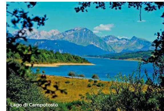
Lago di Campotosto

Degno di nota è il Santuario della Madonna degli Angeli (XVIII sec.), a navata unica, con la facciata decorata da una cuspede, da un timpano e una balconata per le benedizioni. Ha