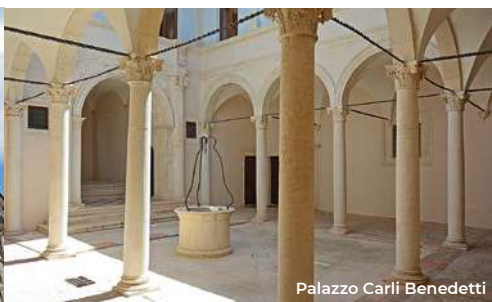
Palazzo Carli Benedetti

Il quarto itinerario inizia da Palazzo Lucenti-Bonanni , dove Corso Vittorio Emanuele incrocia via Castello. Sorto nel XVI secolo e poi rimaneggiato dopo il 1703, il Palazzo, d'architettura rinascimentale e con impianto a ferro di cavallo, si presenta su tre livelli con pesanti contrafforti. Interessante il cortile interno tipico del periodo. (Per le visite: tel. 0862 191 0737) Attraversato Corso Vittorio Emanuele, si prosegue su via Garibaldi per circa 100 m. fino ad incontrare, sulla sinistra, Palazzo Ardinghelli , sorto intorno alla metà del 700 per volere della famiglia omonima. Negli ultimi decenni del XIX secolo fu dimora e atelier del celebre pittore Teofilo Patini. L'edificio, che si sviluppa su due livelli, è uno dei massimi esempi di barocco, atipico rispetto alle architetture cittadine; con l'adiacente Palazzo Cappa Camponeschi costituisce un unico complesso. Interessante l'ingresso con una triplice balconata che ripropone il motivo del timpano, lo scalone monumentale di derivazione borrominiana sovrastato da alcuni preziosi dipinti. Il Palazzo ospita la sede aquilana del MAXXI , museo nazionale delle arti del XXI secolo, un laboratorio dedicato alla produzione