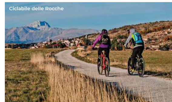
Ciclabile delle Rocche

L'itinerario si conclude a Ovindoli , rinomata