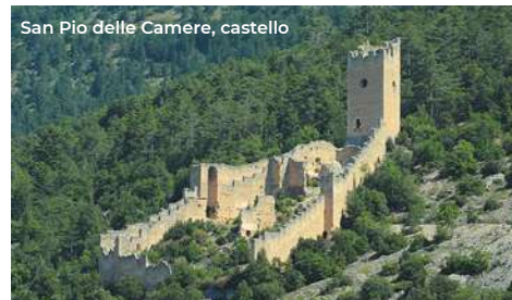
San Pio delle Camere, castello

Un itinerario che attraversa la Piana di Navelli, altipiano carsico-alluvionale situato a circa 700 m s.l.m., e la Valle del Tirino, posta a quote collinari (400-600 m s.l.m.). Il territorio è delimitato dai massicci del Gran Sasso a nord, del Sirente-Velino e della Valle Subequana a sud-ovest e dalle Gole di Popoli a sud-est.