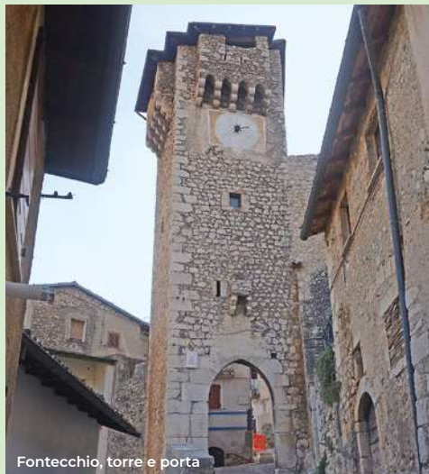
Fontecchio, torre e porta

Let's go back and go along via Belisari and then Via Costa Mandatarario to get to the Porta di Bazzano, perhaps the most imposing of the city walls of the city that appears to us in its monumentality standing between the houses (late 13th century). It is made of stone with a large double-arched arch, flanked by two pairs of simple pilasters. Above there