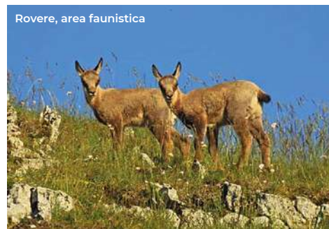
Rovere, area faunistica

di origini antichissime. Si possono visitare i resti del castello (XI sec.), che è di origine normanna ed appartiene a quella tipologia dei castelli-villaggio cinti da mura e torri rompitratte, che si raccordano al torrione principale pentagonale. È ancora possibile riconoscere le casermette dei soldati, l'armeria e la cisterna. Nei pressi c'è la chiesa della Madonna delle Grazie (XIII sec), con la facciata a blocchi di pietra squadrati; il portale ha stipiti e architrave modanati cinquecenteschi, con un campanile a vela a triplo fornice. Poco più giù si trova il Centro Visita dedicato al camoscio , alla fauna e alla vegetazione del Parco, con pannelli informativi e servizi; annessa c'è anche l' area faunistica del Camoscio (per visite tel. 338 2420337).