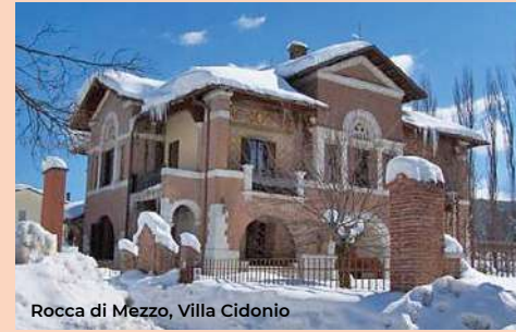
Rocca di Mezzo, Villa Cidonio

Let's go back and go along via Belisari and then Via Costa Mandataro to get to the Porta di Bazzano, perhaps the most imposing of the city walls of the city that appears to us in its monumentality standing between the houses (late 13th century). It is made of sto-