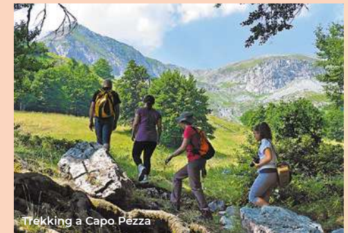
Trekking a Capo Pezza

Going further 300 meters south we arrive at Porta Napoli. Always part of the urban wall