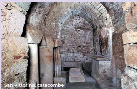
San Vittorino, catacombe

The neoclassical porticoed exedra that wel-