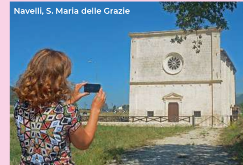
Navelli, S. Maria delle Grazie

The neoclassical porticoed exedra that wel-