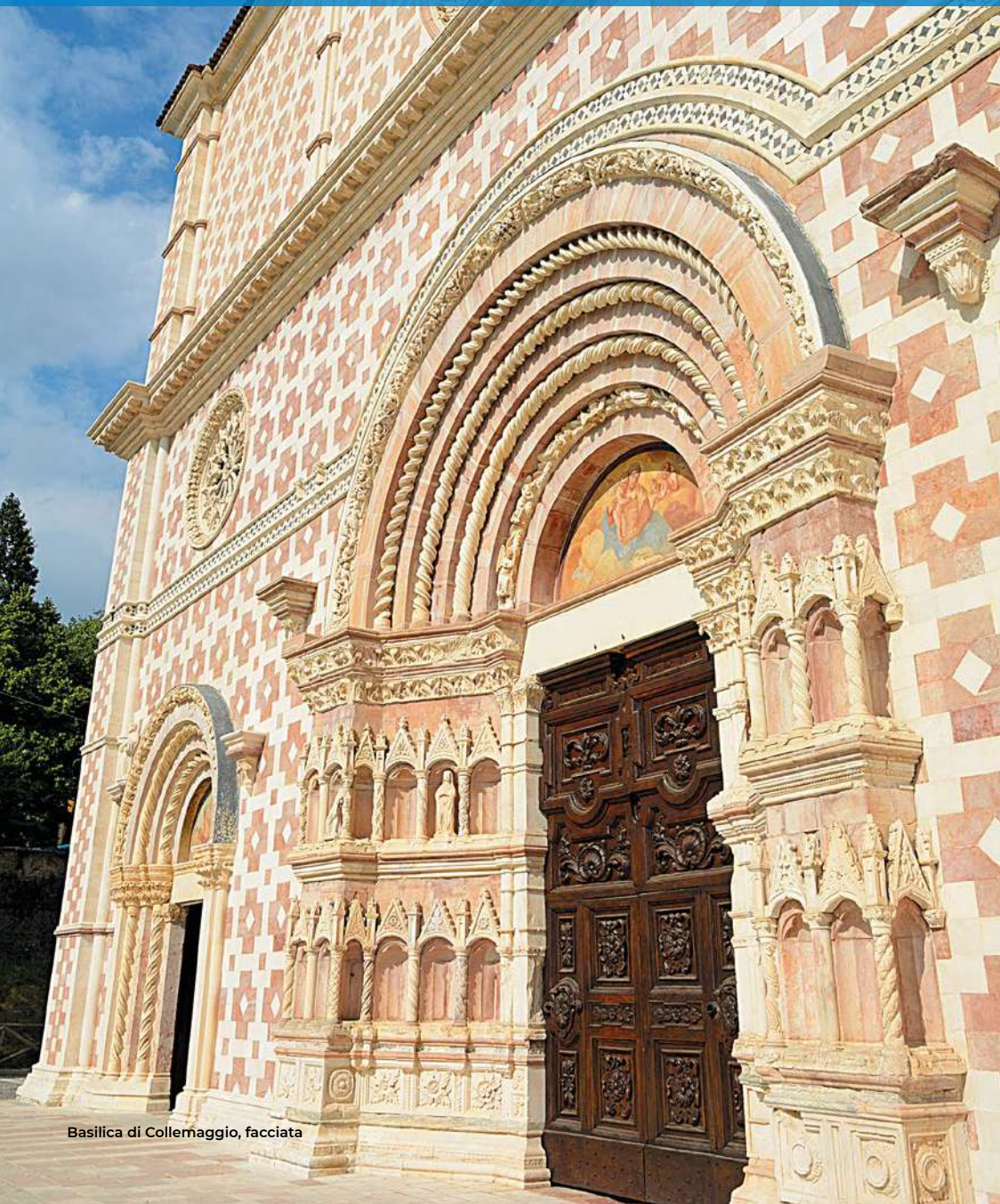
Basilica di Collemaggio, facciata