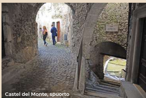
Castel del Monte, spuerto

Let's go back and go along via Belisari and then Via Costa Mandatarario to get to the Porta di Bazzano, perhaps the most imposing of the city walls of the city that appears to us in its monumentality standing between the