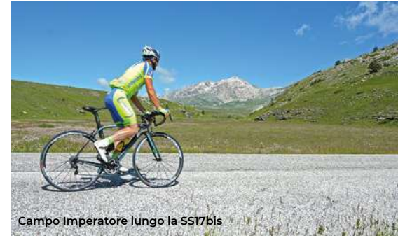
Campo Imperatore lungo la SS17bis

sec.) fu completato nel 1765 con un conventino e con un campanile a vela. Seguendo per 5 km verso l'Aquila si arriva alla chiesa di San Felice Martire (XII-XVI sec.) a Poggio Picenze, di rilievo la facciata rinascimentale, con interno barocco (attualmente non visitabile all'interno). Ci si sposta in territorio aquilano per 11 km a nord e si raggiunge la Riserva delle Sorgenti del Fiume Vera a Tempera. Qui si trovano tre sentieri naturalistici con mulini ad acqua, con folta vegetazione arborea, oltre a un lussureggiante sottobosco e una ricca avifauna (visite