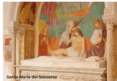
Santa Maria del Soccorso

Il secondo itinerario inizia dalla chiesa di S. Maria del Soccorso , posta a nord-est, fuori le mura cittadine. Costruita alla fine del XV sec., colpisce per l'originale sintesi tra elementi medievali e rinascimentali e la riproposizione della bicromia bianco/rosa a liste orizzontali; la pianta è a croce greca, caratterizzata dalla presenza di due torrioni. (per la visita: 0862 26059). Spostandosi in direzione nord-est su viale Panella e poi a sinistra su via Pescara, si arriva a Porta Castello : eretta contemporaneamente al Forte spagnolo (XVI sec.), mostra gli stemmi della Casa d'Austria e di Carlo V. Subito a destra, entrando nel Parco, si può apprezzare l'imponenza del castello, che costituisce un particolarissimo esempio di architettura militare cinquecentesca. L'edificio, a pianta quadrata, presenta un cortile interno circondato da quattro grandi bastioni angolari ed è protetto da un enorme fossato, in cui si erge il recinto poligonale bastionato, con un imponente ponte in muratura per l'accesso alla