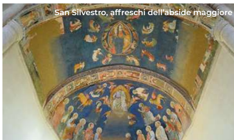
San Silvestro, affreschi dell'abside maggiore

Il quarto itinerario inizia da Palazzo Lucenti-Bonanni , dove Corso Vittorio Emanuele incrocia via Castello. Sorto nel XVI secolo e poi rimaneggiato dopo il 1703, il Palazzo, d'architettura rinascimentale e con impianto a ferro di cavallo, si presenta su tre livelli con pesanti contrafforti. Interessante il cortile interno tipico del periodo. (Per le visite: tel. 0862 191 0737) Attraversato Corso Vittorio Emanuele, si prosegue su via Garibaldi per circa 100 m. fino ad incontrare, sulla sinistra, Palazzo Ardinghelli , sorto intorno alla metà del 700 per volere della famiglia omonima. Negli ultimi decenni del XIX secolo fu dimora e atelier del celebre pittore Teofilo Patini. L'edificio, che si sviluppa su due livelli, è uno dei massimi esempi di barocco, atipico rispetto alle architetture cittadine; con l'adiacente Palazzo Cappa Camponeschi costituisce un unico complesso. Interessante l'ingresso con una triplice balconata che ripropone il motivo del timpano, lo scalone monumentale di derivazione borrominiana sovrastato da alcuni preziosi dipinti. Il Palazzo ospita la sede aquilana del MAXXI , museo nazionale delle arti del XXI secolo, un laboratorio dedicato alla produzione