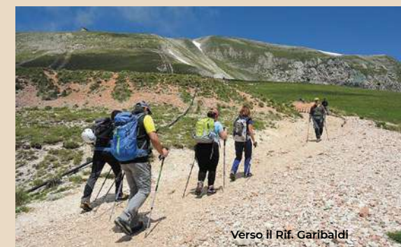
Verso il Rif. Garibaldi

Going further 300 meters south we arrive at Porta Napoli. Always part of the urban wall