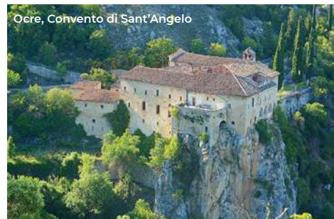
Ocre, Convento di Sant'Angelo

Un itinerario che conduce alla scoperta della Media e Bassa Valle dell'Aterno, un territorio vasto, prevalentemente collinare (500 m slm), caratterizzato dalla vitale presenza del fiume Aterno. Circondato da nord-ovest a sud-ovest dalla catena montuosa del Sirente-Velino e dall'altopiano delle Rocche, a nord-est, oltre la bassa catena montuosa che la delimita, si estendono la Piana di Navelli e la Valle del Tirino, mentre a sud-est, oltre il Monte Urano, è situata la valle Peligna.