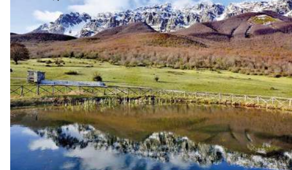
Secinaro, prati del Sirente

esempio di edificio sacro a doppia navata; interessanti gli affreschi del '500 e alcune statue settecentesche (Per la visita tel. Comune 0864 79302 - 340 2353025). Salendo in quota con la S.P. 11 Sirentina, a circa 12 km si trovano i Prati del Sirente , piccolo altipiano carsico a 1100 m di quota, circondato da superbe faggete, con lo stupendo scenario del Monte Sirente. Da qui partono alcuni sentieri del Parco Sirente-Velino che soddisfano gli appassionati di trekking, mtb ed equestrianismo, con alcune aree picnic e fonti (Ufficio Informazioni Parco Sirente-Velino Castelvecchio Subequo tel. 0864 790246)..