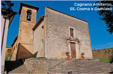
Cagnano Amiterno, SS. Cosma e Damiano

fourteenth and fifteenth centuries, we arrive at the bottom of the right side nave where the chapel-sepulcher of Celestino V is located, containing its body (XVI century). It was built on a project by Girolamo da Vicenza in imitation of the San Bernardino mausoleum. The Basilica is open every day from 9.30 to 12.30 and from 15 to 18.