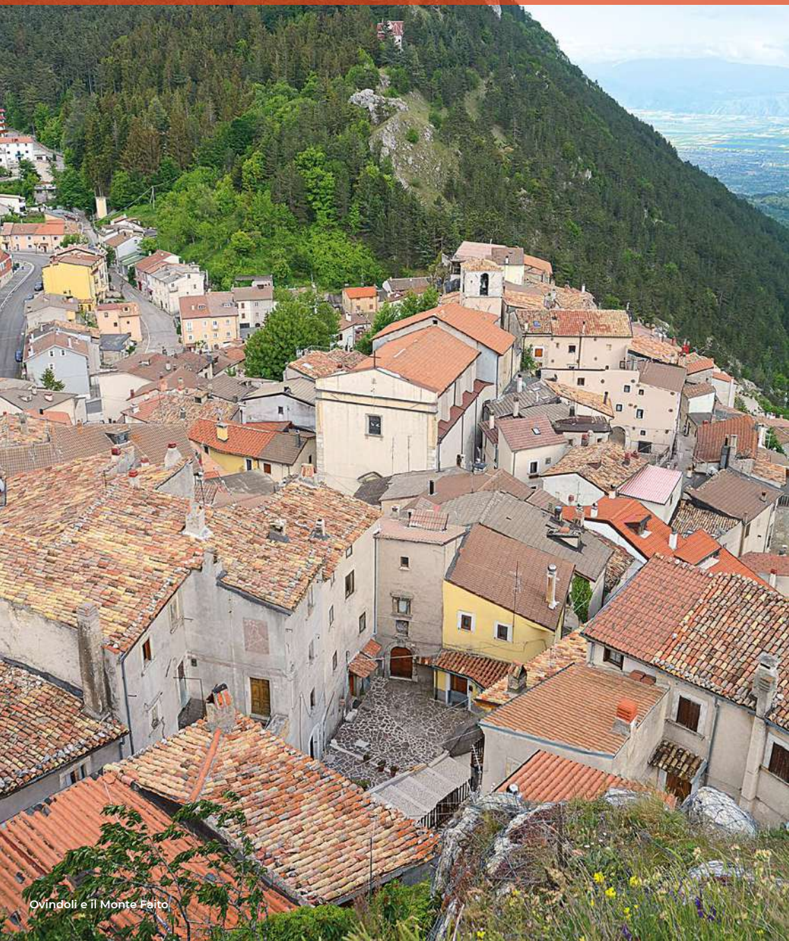
Ovindoli e Il Monte Faito