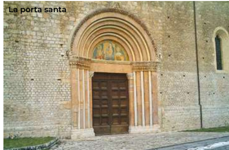
La porta santa

lunga aula a tre navate con transetto, conchiusa da tre absidi. Rimaneggiata più volte a causa dei terremoti, presenta una commistione di diversi stili architettonici, dal gotico al barocco. Nel 2020, dopo l'importante restauro post sisma, la basilica ha avuto l'importante riconoscimento dell'European Heritage Awards. Internamente, guidati dai giochi geometrici della pavimentazione, anch'essa bicroma, tra affreschi del Trecento e del Quattrocento nelle nicchie delle pareti, si arriva in fondo alla navata laterale destra, dove è collocata la cappella-sepolcro di Celestino V. Il monumento è stato realizzato nel 1517 da Girolamo da