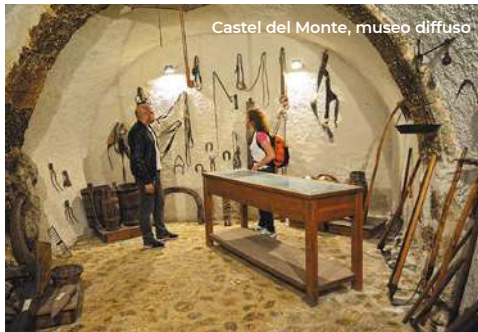
Castel del Monte, museo diffuso

rettangolare; interessante la bella sequenza di "sporti" e il Museo Diffuso (Civico ed Etnografico). Salendo si incontrano il Palazzo del Governatore e il Palazzo Colelli, con interessanti elementi medievali e rinascimentali. Nella parte bassa del borgo c'è invece la chiesa della Madonna del Suffragio (XV sec.), ricca di decorazioni barocche in stucco, con altare ligneo e il prezioso organo dorato.