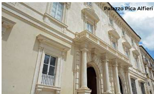
Palazzo Pica Alfieri