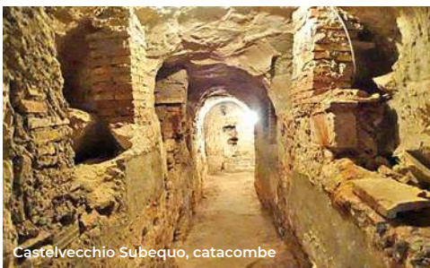
Castelvecchio Subequo, catacombe

A ridosso del centro c'è la chiesa della Madonna del Colle (XVI sec.), dal ricco altare seicentesco con colonne tortili (per la visita tel. Comune 0864 79141). A 3 km a sud si trova Castelvecchio Subequo , che custodisce il patrimonio archeologico dell'antica Superaequum (I sec. A.C.), i cui resti di mura, acquedotti, edifici civili, templi sono in c.da Macrano. In paese degno di nota è il convento di San