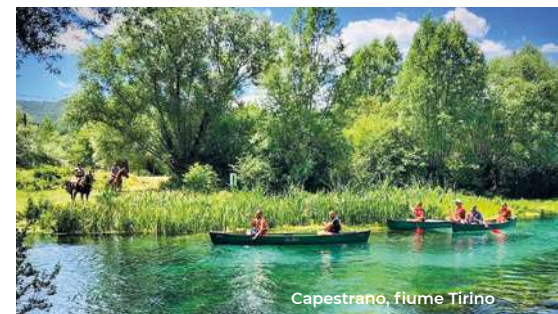
Capestrano, fiume Tirino

stato dal Castello Piccolomini (XV sec.) con i suoi due torrioni cilindrici e la torre quadrata. Il paese ha dato i natali al francescano san Giovanni da Capestrano , la cui casa natale è visitabile su prenotazione. Sempre a san Giovanni si deve la costruzione del convento che ospita un museo e una biblioteca, custode di preziosi volumi. Interessanti sono il chiostro e la chiesa