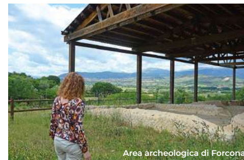
Area archeologica di Forcona

Montelucio; il colle è a circa 1000 metri di quota e da qui si abbraccia l'intera città dell'Aquila. Vi prospera una folta pineta , detta di Roio , meta escursionistica con diversi sentieri accessibili. Altra nota area naturalistica del circondario aquilano è la Pineta di San Giuliano , col vicino Convento (10 km a nord). Consacrato nel 1415, fu una delle prime sedi dell'Osservanza francescana e vi passarono san Giovanni da Capestrano e san Bernardino da Siena. Conserva il chiostro originario con arcate a tutto sesto e lunette affrescate con la vita di s. Giovanni. Annesso alla chiesa vi è il Conventino (XIII sec.) con portale e finestre gotiche. L'interno della chiesa è ricco di numerose opere del pittore Saturnino Gatti (XV-XVI sec.) e Vincenzo Damiani (la