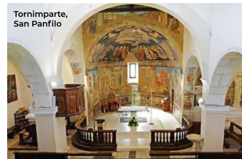
Tornimparte, San Panfilo

Il viaggio inizia da Tornimparte , comune composto da più centri abitati, immersi in una natura incontaminata. Nel centro principale, Villagrande, è possibile visitare la chiesa di San Panfilo (XII sec.), al cui interno, a quattro navate, si conserva nel catino absidale uno splendido ciclo di affreschi di Saturnino Gatti (1495) detto il Michelangelo d'Abruzzo, raffigurante il Paradiso sulla volta e episodi della Passione