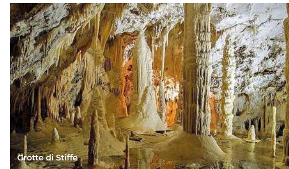
Grotte di Stiffe

Ci si sposta quindi a sud per 2 km verso il monastero-fortezza di Santo Spirito . È il primo insediamento cistercense nella Valle dell'Aterno (1248); oggi ospita una residenza storica (per le visite tel. 340 7368283). In circa 5 km verso valle si raggiunge la chiesa di Santa Maria ad Cryptas (XIII sec.) a Fossa. L'interno è decorato da uno dei più completi cicli pittorici del duecento abruzzese (1265/1280 circa). A circa 3 km ad est, nella piana sottostante, si trova la Necropoli di Fossa (VIII-II sec. a.C.), estesa area funeraria dei Vestini, ricca di sepolture a tumulo, a fossa e a camera (Per le visite SABAP, tel. 0862 21701 - 21730 - 21732). Si prosegue verso il borgo di Sant'Eusanio Forconese (5 km ad est), dove con una breve passeggiata è possi-