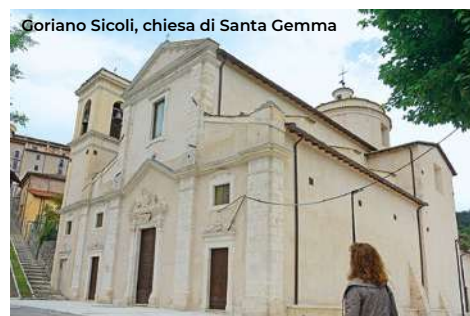
Goriano Sicoli, chiesa di Santa Gemma

A 250 m si trova il bivio per il suggestivo eremo della Madonna di Pietrabona (XII sec.), posto su un terrazzo roccioso. Un'ampia gradinata conduce al sagrato della chiesa; interessante la grotta, ritenuta miracolosa (per la visita tel. 346 3207741). Ancora a sud per 2,5 km si trova Goriano Sicoli , con la chiesa-santuario di Santa Gemma . Fu costruita nei pressi della cella monacale della Santa nel 1613; all'interno anche una tela del pittore abruzzese Teofilo Patini. Nel centro storico si trova la casa da lei abitata, con pannelli informativi e ricordi. In via Paolucci resta la monumentale Fontana (1888), orna-