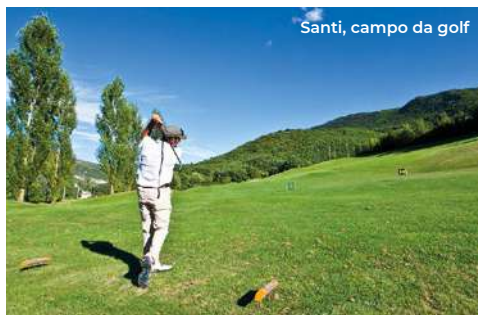
Santi, campo da golf

combe. L'edificio presenta la pianta a croce latina, transetto e abside semicircolare; nel catino absidale restano tracce di affreschi del XIII secolo. Interessante anche la cripta, il cui altare maggiore è decorato con dipinti narranti il martirio di S. Vittorino. Una scalinata porta ai sotterranei che ospitano le catacombe di San Vittorino (V sec.) (visita guidata alla chiesa e alle catacombe: sabato 11-11,30 / 12-12,30; domenica 16-16,30 / 17-17,30; tel. 0862 463010 - 346 2166953). Spostandosi in direzione ovest, dopo 6 km si giunge a Santi di Preturo, dove c'è un bel campo da golf a 18 buche, distribuito su 5 km di lunghezza (Par: 68), corredato da tutti i servizi. Tornando verso sud (6 km) si raggiunge Preturo , con la chiesa di San Pietro (XII sec.), dalla bella facciata in pietra, con portale romanico e campanile a vela. All'interno importanti affreschi del XII - XVI sec. (per la visita tel. 0862 461319). Sempre in territorio aquilano , in direzione sud (3,5 km), si incontra la chiesa di San Pietro apostolo di Coppito (XIII sec.); ha la facciata in stile romanico in pietra, con portale a timpano cuspidato, con tre absidi semicircolari e un campaniletto a vela. L'interno barocco è a