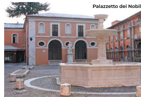
Palazzetto dei Nobili