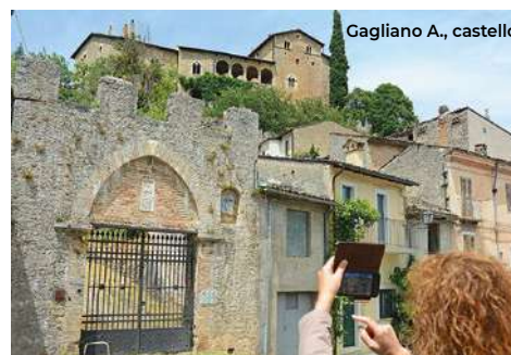
Gagliano A., castello

In via Municipio c'è il Monastero di Santa