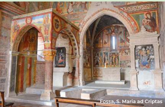
Fossa, S. Maria ad Criptas

The first thing that catches your eye when you reach the square is the majestic facade of white and pink limestone basole, with three portals dating back to the fifteenth century, surmounted by Romanesque rose windows, of which the central and the left are of clear Gothic matrix. Wanted by Celestino V and founded in 1288, the basilica has a long hall