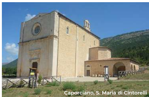
Caporciano, S. Maria di Cintorelli

Si prosegue l'itinerario verso Navelli sulla SS153 (7 km). A circa metà strada si incontra la chiesetta di Santa Maria delle Grazie (XVI sec.), con la tipica facciata a coronamento orizzontale di tradizione aquilana e il piccolo rosone.