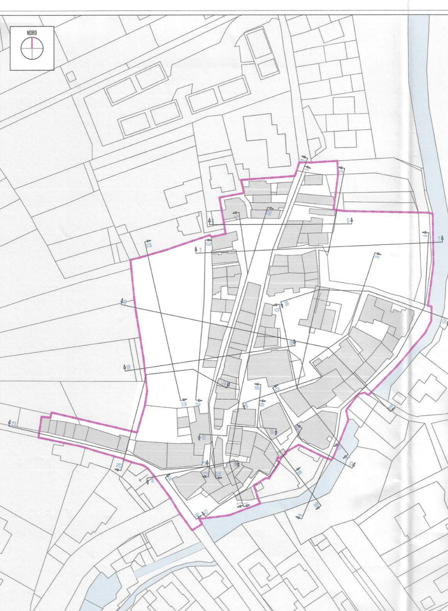
INDIVIDUAZIONE DEI PROFILI PLANIMETRIA GENERALE