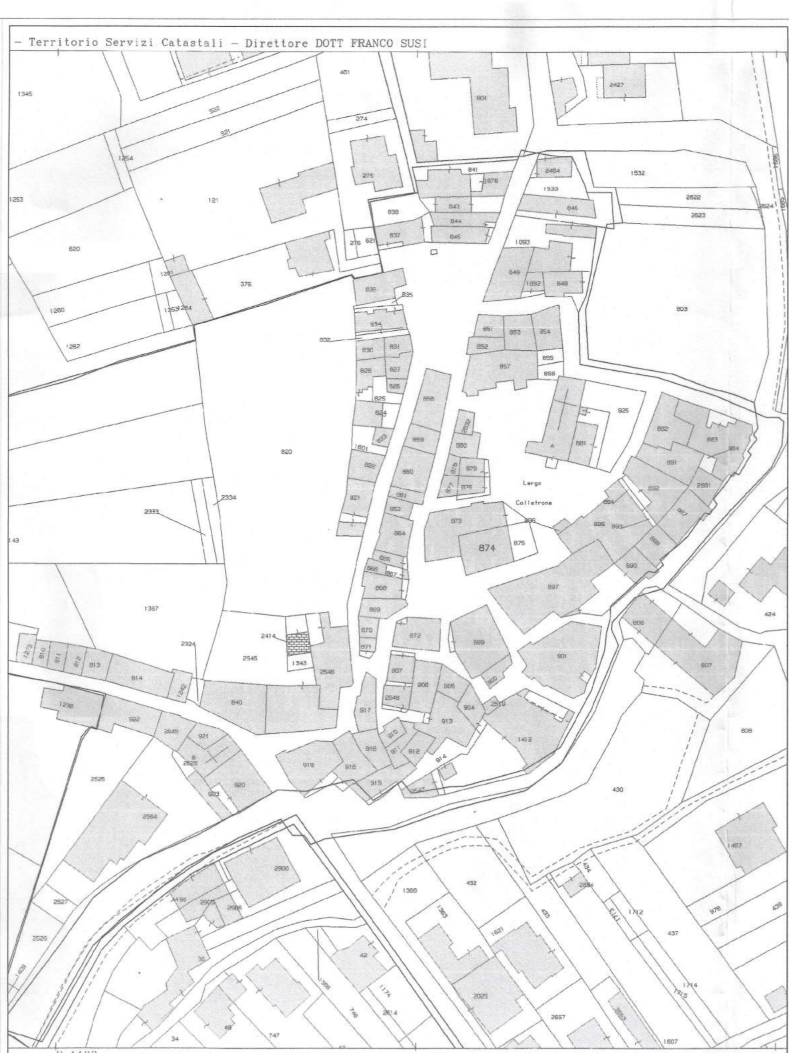
COMUNE DI L'AQUILA - SEZIONE E FOGLIO 9 ALLEGATO A STRALCIO DELLA PLANIMETRIA CATASTALE (04 apr. 2015)

data: 09.12.2016 elaborato: PROG - R - 12_01 scala: 1:300 ing. Sergio Alfonselli ing. Michele Amorosio arch. Antonio Castellucci arch. Paolo Crocetti arch. Desolina Mori ing. Laura Pasquantonio ing. Gianfranco Ruggieri ing. Antonello Salvatori arch. Vincenzo De Masi arch. Giampiero Duronio